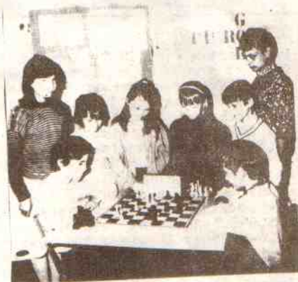
Najlepsi szachiści - juniorzy

W turnieju dominowały drużyny zagraniczne. Zwyciężyła drużyna ze Lwowa druga była Ostrawa /CSRF/ przed ROW Rybnik. Przełom zajął XIII miejsce wygrywając 7:1 z DPP Żory, 7:1 z TS Neslusa /CSRF/, 6:2 z Schachclub 90 /NRD/, 5,5:2,5 z Górnikiem Czerwonka i w tym samym spotkaniu z Kolejarczem Katowice. Porazki Postominianie doznali z drużynami: Frydek Mistek /CSRF/ 1:7, ROW Rybnik 1,5:6,5, Promień Mońki 3:5, Kowno /Litwa/ 3:5. Dzięki dobrej postawie w Rybniku młodsi szachiści z Postomina otrzymali zaproszenie do udziału w międzynarodowym turnieju w Homlu /ZSRR/.