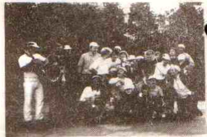
Zwycięska ekipa U.G. Postomino