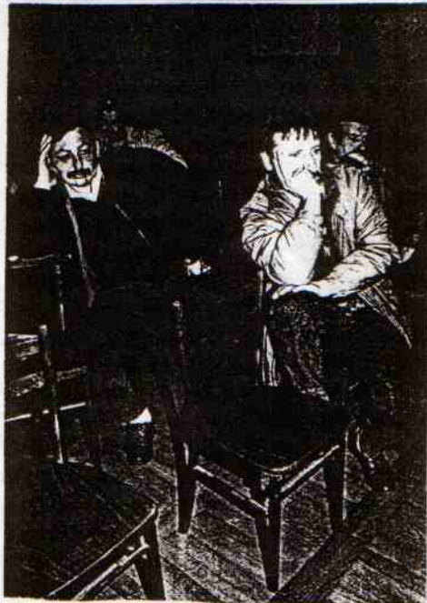
Wszyscy słuchają z uwagą wyjaśnień posła.