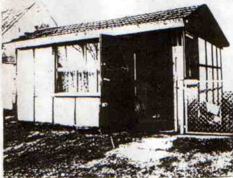
Sklepek ciasny, ale ... własny.