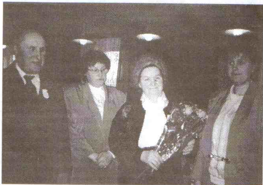
Podczas uroczystości z okazji 50-lecia pożycia małżeńskiego.