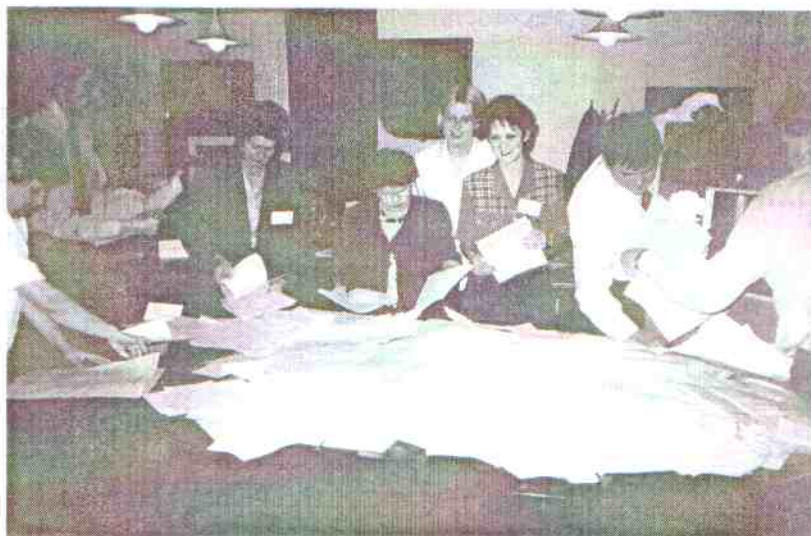
Obwodowa Komisja Wyborcza w Postominie przystępuje do liczenia głosów. Pracę tę zakończy ok. 2 00 w nocy.