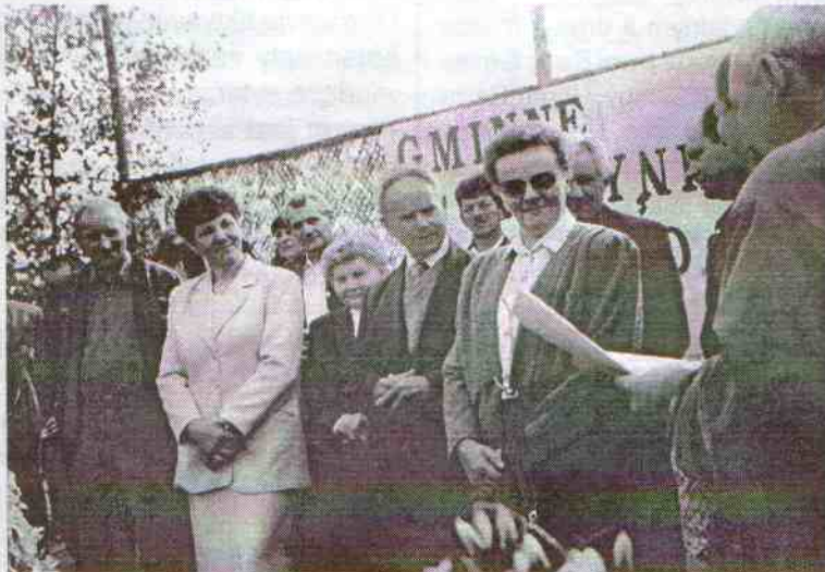
Główni bohaterowie dożynek - sołtysi; odprawa.