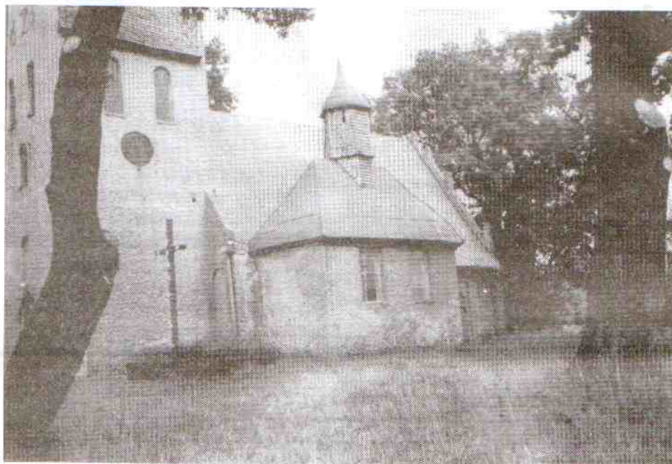
Pieszczański kościółek w wiosennej szacie.