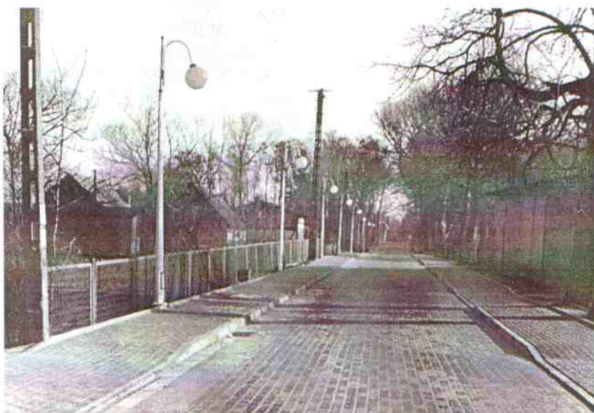
Jarosławiec w nowej szacie czeka na turystów.