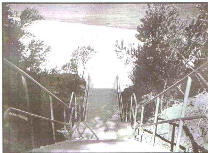
Nowe zejście na plażę przy OW „Mikołajek”

„Pas startowy” to potoczna nazwa pięknego zakamarka Jarosławca, gdzie często i chętnie przebywają letnicy, by w otoczeniu pięknego, sosnowego lasu i czystej plaży wypoczywać.