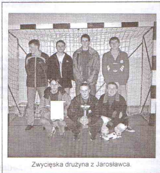
Zwycięska drużyna z Jarosławca.