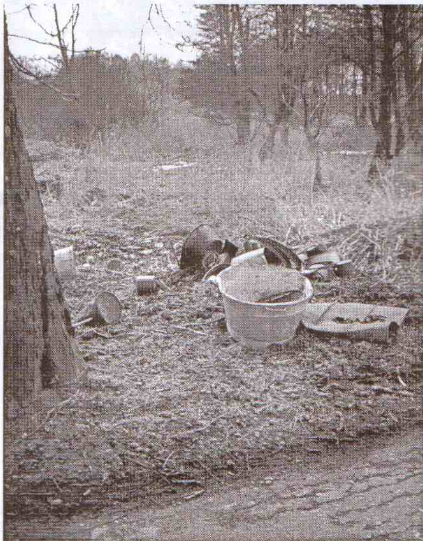
Takie dzikie wysypisko usytuowane jest tuż przy wjeździe do Pieszcza.

Olga Szczepocka Insp. ds. ochrony środowiska