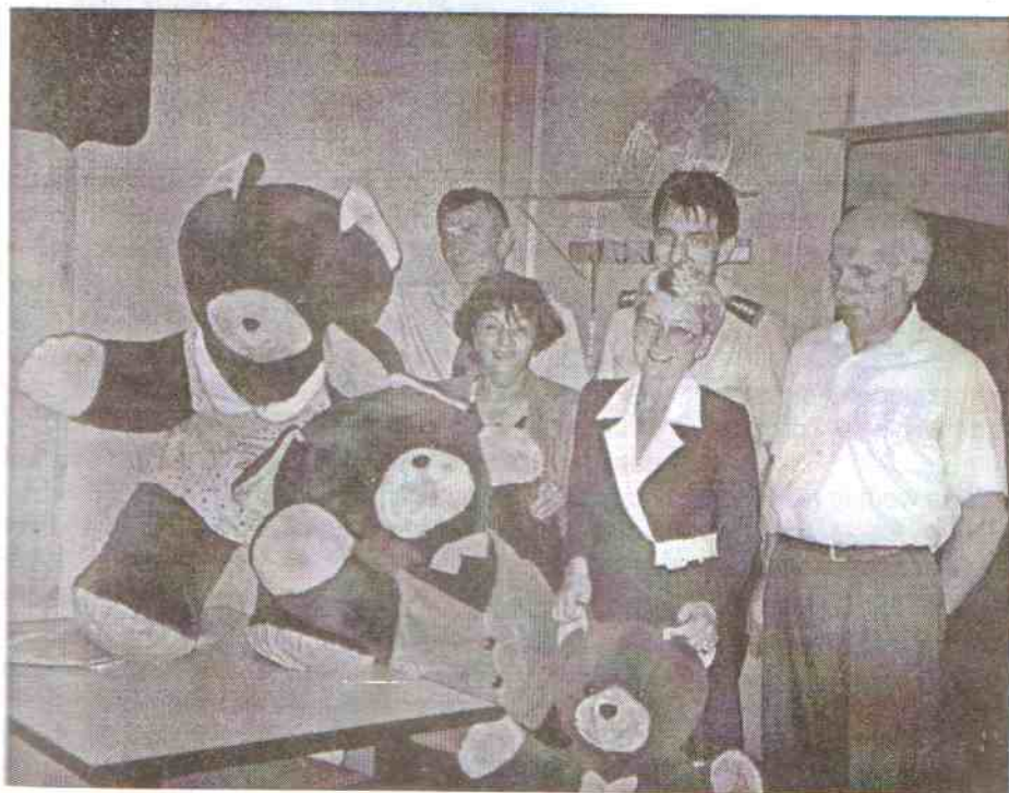
Gminna Komisja Rozwiązywania Problemów Alkoholowych przekazuje miśki koordynatorom świetlic środowiskowych.

miśki (niekiedy przewyższały one dziecko), przytulały się, układały się na nich, czuły się jak w objęciach Mamy czy Taty. Obmyślane zostały imiona, wydane zostało przyjęcie - oczywiście bezalkoholowe - na cześć nowych członków świetlic. Jest bardzo sympatycznie.