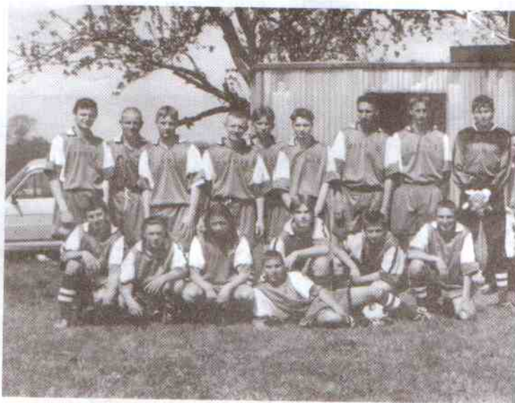
Drużyna juniorów „Przełomu” w pełnym składzie w strojach ufundowanych przez firmę „CERMAG” z Kłośnika.