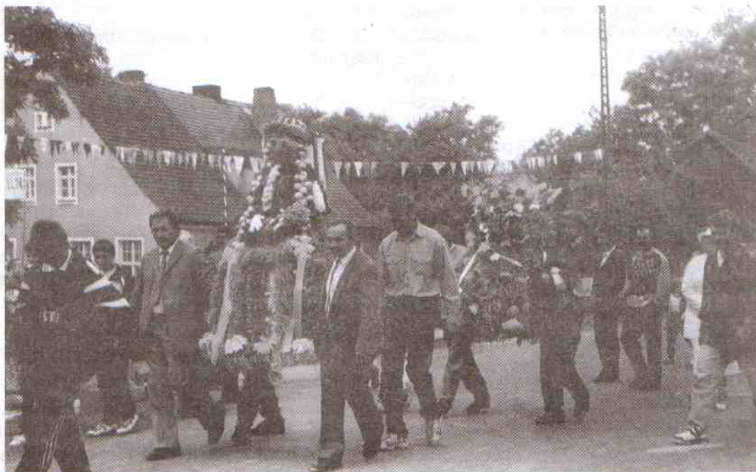
Przemarsz dożynkowego korowodu.