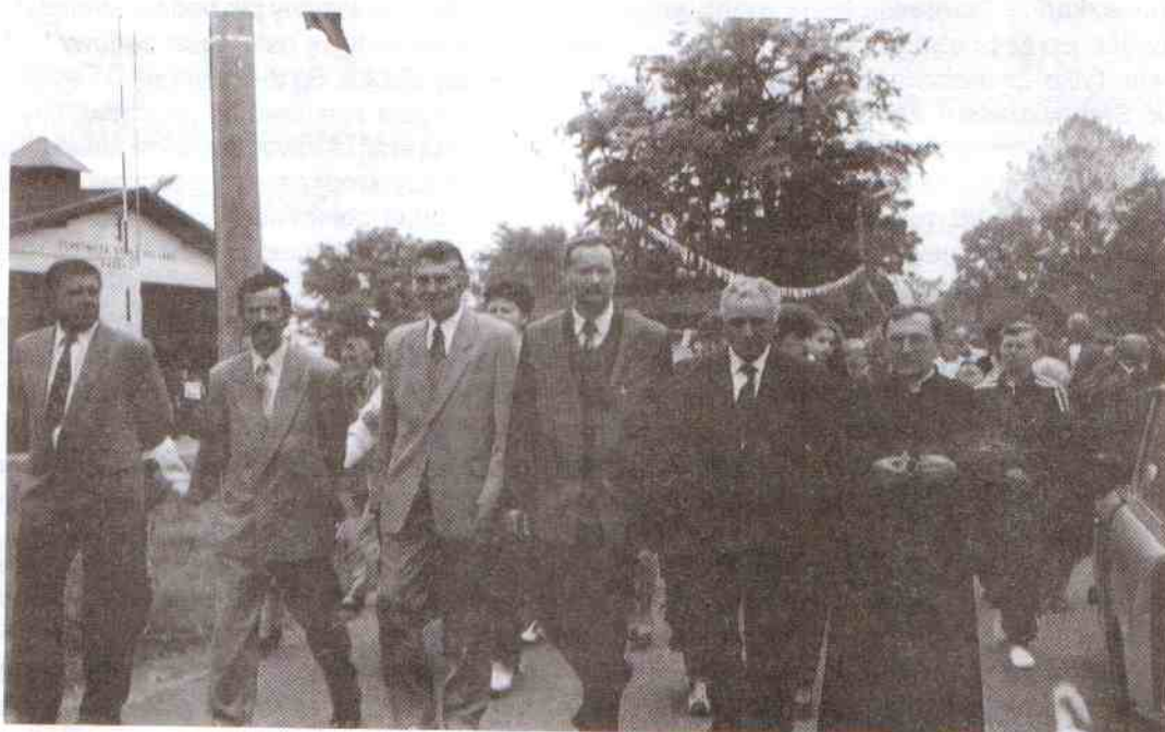
Najwyższe władze gminy zawitały do Karsina.