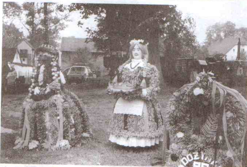
Takie baby zjechały do Karsina na dożynki.