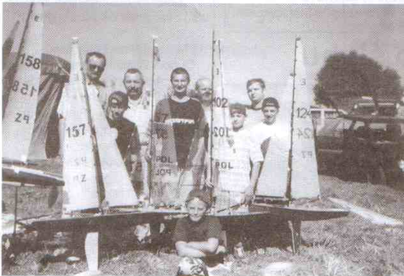
Na zdjęciu pieszcańska drużyna modelarzy z duchowym wsparciem Wójta i dyrektora AMGISP.