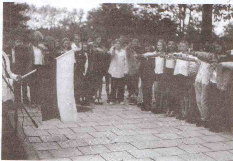
Uroczysty moment ślubowania uczniów kl. I Gimnazjum w Postominie.

...brzmi to dumnie, ale i zobowiązująco.