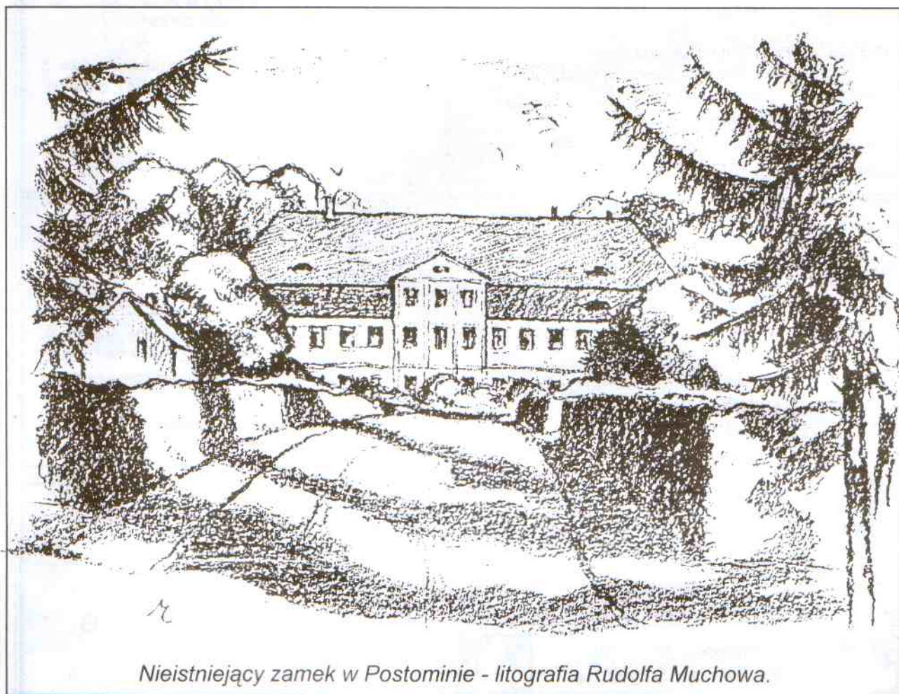
Nieistniejący zamek w Postominie - litografia Rudolfa Muchowa.

Nazwa wsi pochodzi od pusty = pustkowie, głusza. W starych dokumentach - Postomino.