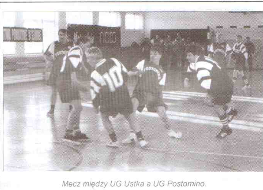
Mecz między UG Ustka a UG Postomino.