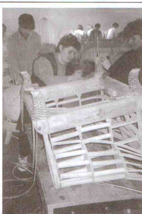
W wyremontowanej byłej sali gimnastycznej w Pieńkowie powstają eleganckie meble produkowane przez pracowników firmy Rattan Prestige.