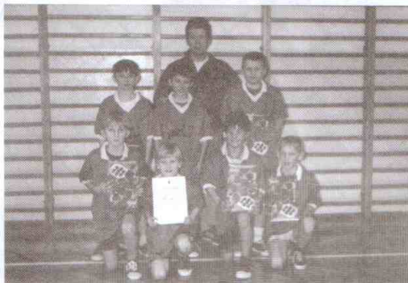
W kategorii chłopców zwyciężyli uczniowie z Jarosławca.