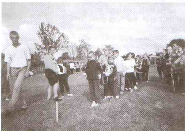
Gry i zabawy.