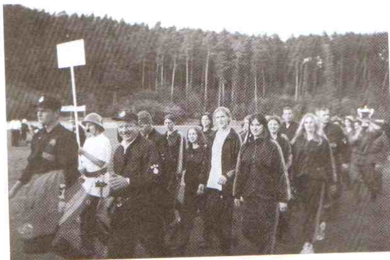
Kobieca drużyna z Chudaczewa,

dów sportowo – pożarniczych dla jednostek OSP nie przewiduje