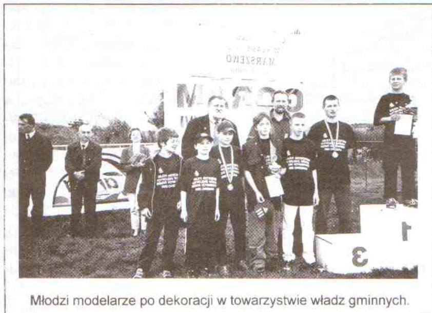
Młodzi modelarze po dekoracji w towarzystwie władz gminnych.