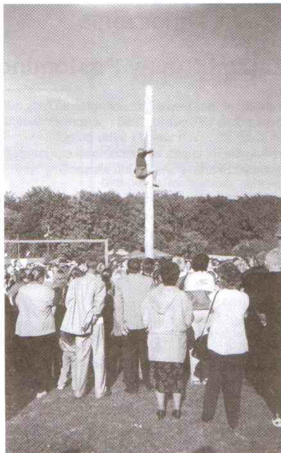
Mało było osób, które dotarły do szczytu.

1. Emilia Ciołak - Wilkowice 2. Kamila Bonowicz - Królewko