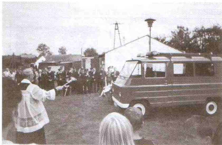
Poświęcenie wozu bojowego