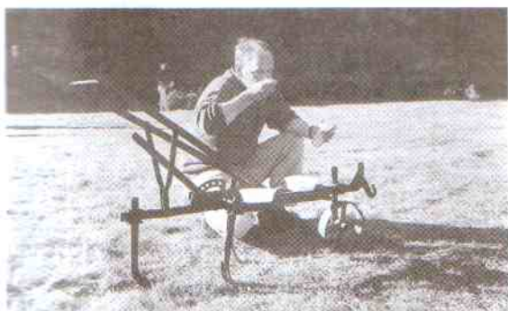
Z takim opielaczem trzeba było przebiec prawie 100 m.

Tegoroczne dożynki były rekordy frekwencji. Z pewnością przysłużyła się temu słoneczna, piękna pogoda. Ale trzeba też i przyznać, że, jak co roku nie zawiodła bardzo dobra organizacja. Formuła festynu ludowego połączona ze współzawodnictwem międzysołeckim sprawdziła się. Zauważa się, że następuje swo-