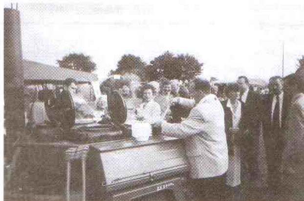
Grochówka i bigos dla wszystkich