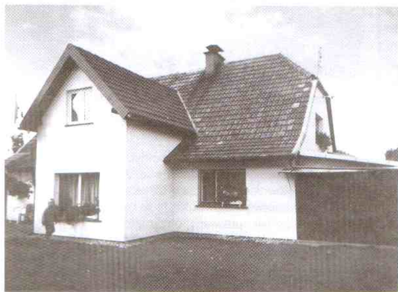
Najładniejsza posesja – Wspólnota Mieszkaniowa Naćmierz 14,