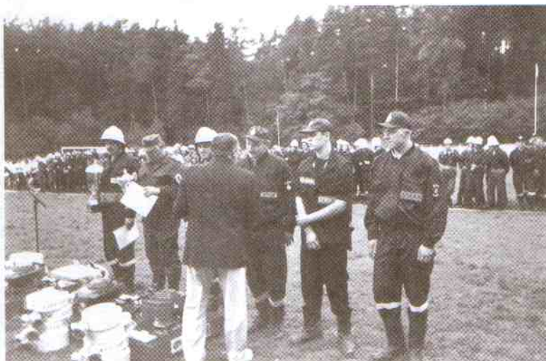
Drużyna męska OSP Chudaczewo odbiera puchary i nagrody za IV miejsce.

Organizatorzy nie bardzo panowali nad przebiegiem zawodów. Biegi sztafetowe miały się odbywać zgodnie z regulaminem zawodów co 4 minuty. Wyniki również miały być podawane na bieżąco. Bywało, że czasy te wydłużały się znacznie. Gdy drużyna powiatu sławieńskiego (OSP Karsino – męska), uzyskała bardzo dobry wynik, zagrażający pozycji drużynom koalicji gospodarzy i szczecińskich, sędziowie długo zwlekali z ogłoszeniem wyniku i po ponad 10 minutach od zakończenia biegu „poczęstowali” naszą drużynę 10 punktami karnymi. Decyzja ta pozbawiła praktycznie drużynę z