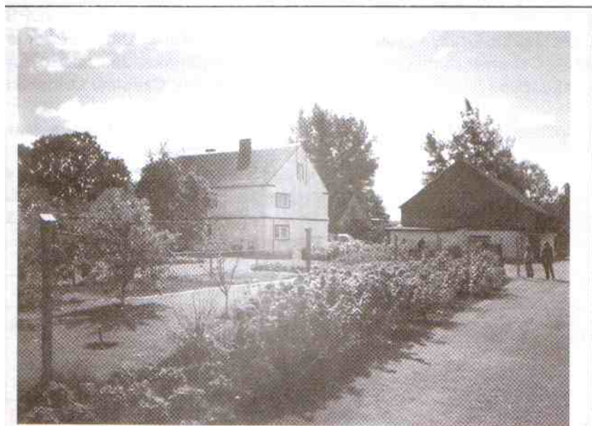
Najładniejsza zagroda – R. Wanago