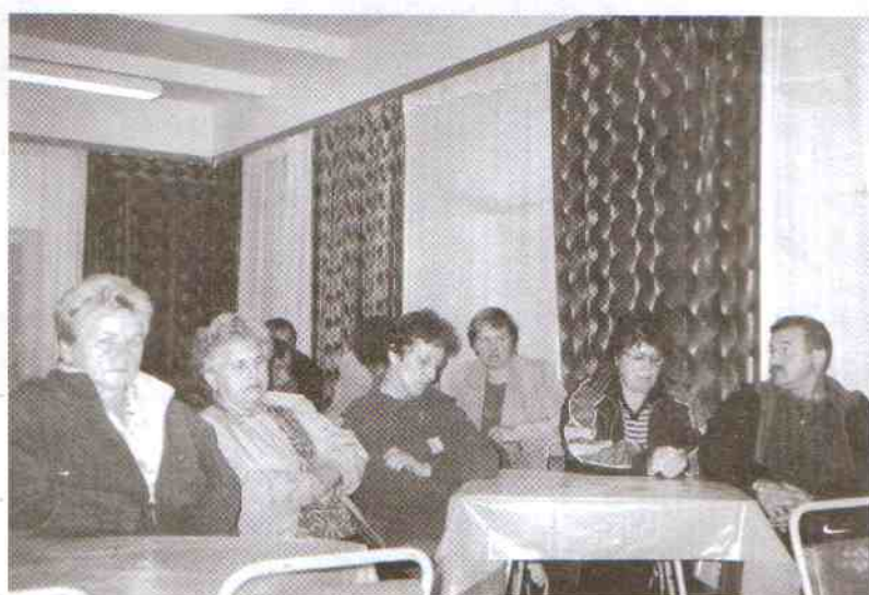
Na spotkanie przybyli mieszkańcy Jarosławca, sołtysi okolicznych wsi, radni gminy.

W dalszej części dyskusji skupiono się na poprawieniu bezpieczeństwa pieszych wzdłuż dróg z Rusinowa poprzez Jarosławiec do Jezierzan. Postulowano wydzielenie dróg dla pieszych i rowerzystów oraz budowę dodatkowej kładki obok mostu w kierunku Jezierzan. Problemem w wykonaniu tych zamierzeń może być to, że ewentualne ciągi przebiegną przez tereny należące do Lasów Państwowych, a te są nieskore do inwestowania. Natomiast ustawa budżetowa nie zezwala urzędowi gmin na finansowanie zadań na gruntach nie będących ich własnością. Zgodzono się, że należy ciągle poszukiwać możliwości poprawienia bezpieczeństwa pieszych. Jak zapewnił wójt, w przyszłym roku ruszy budowa kanału „ULGI”, co spowoduje ustabilizowanie poziomu wody w jeziorze Wicko. Następnym będzie osuszenie szerszego pasa drogowego i stworzenie możliwości dla budowy ciągu pieszego. Wybudowany zostanie też pomost dla kąpiących się