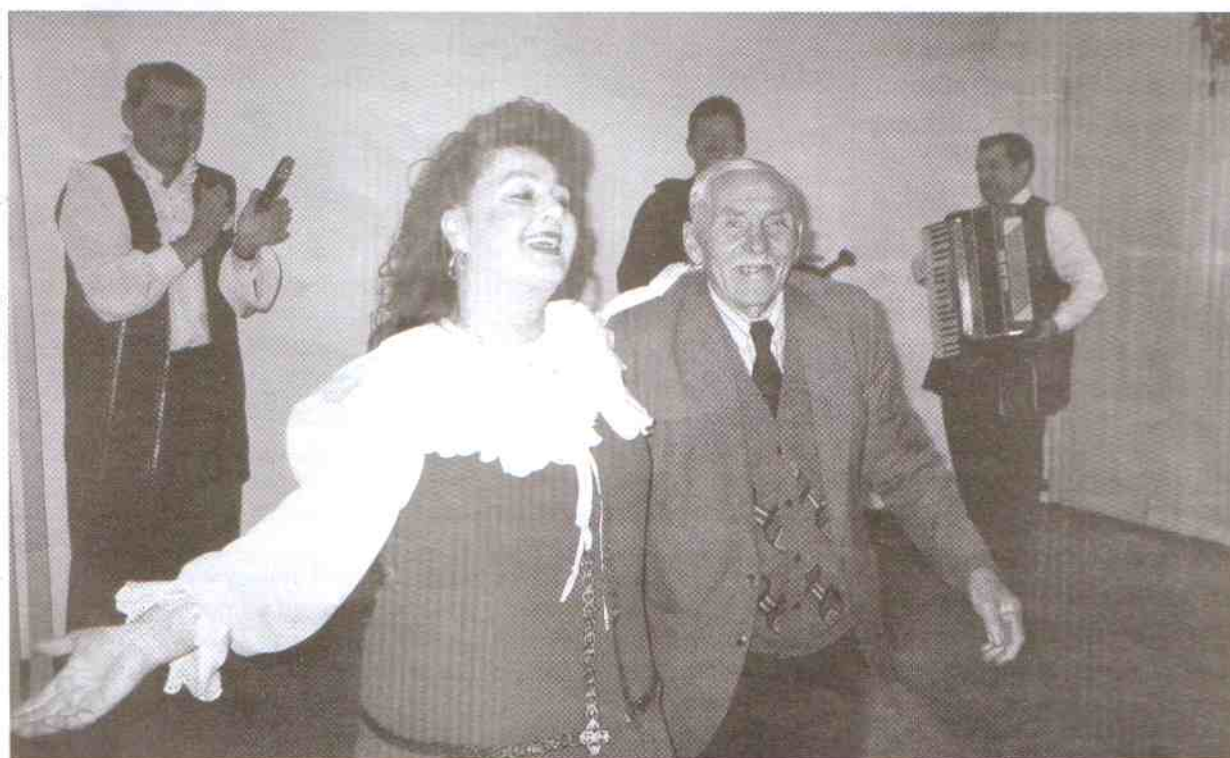
...ich taniec był ognisty.