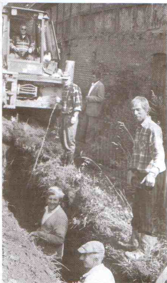
Budowa wodociągu w Karsinie.