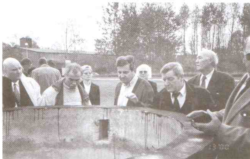
Główny projektant objaśnia zasady działania.