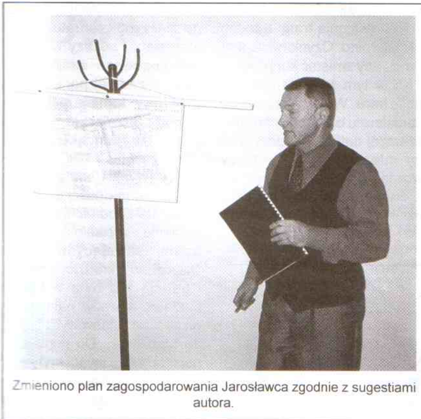
Zmieniono plan zagospodarowania Jarosławca zgodnie z sugestiami autora.

w sezonie w soboty i niedziele), brak oświetlenia Jarosławca, krótki czas otwarcia posterunku policji w Jarosławcu i zalegających śmieciach na plaży zachodniej.