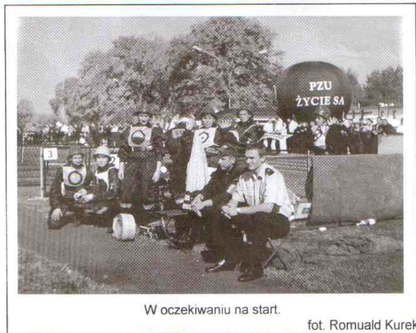
W oczekiwaniu na start.

ważnie kilkorga dzieci. Niemniej jednak liczy się chęć dania z siebie jeszcze czegoś więcej, pokazać się poza miejscem zamieszkania, rozstawić swoją miejsco-