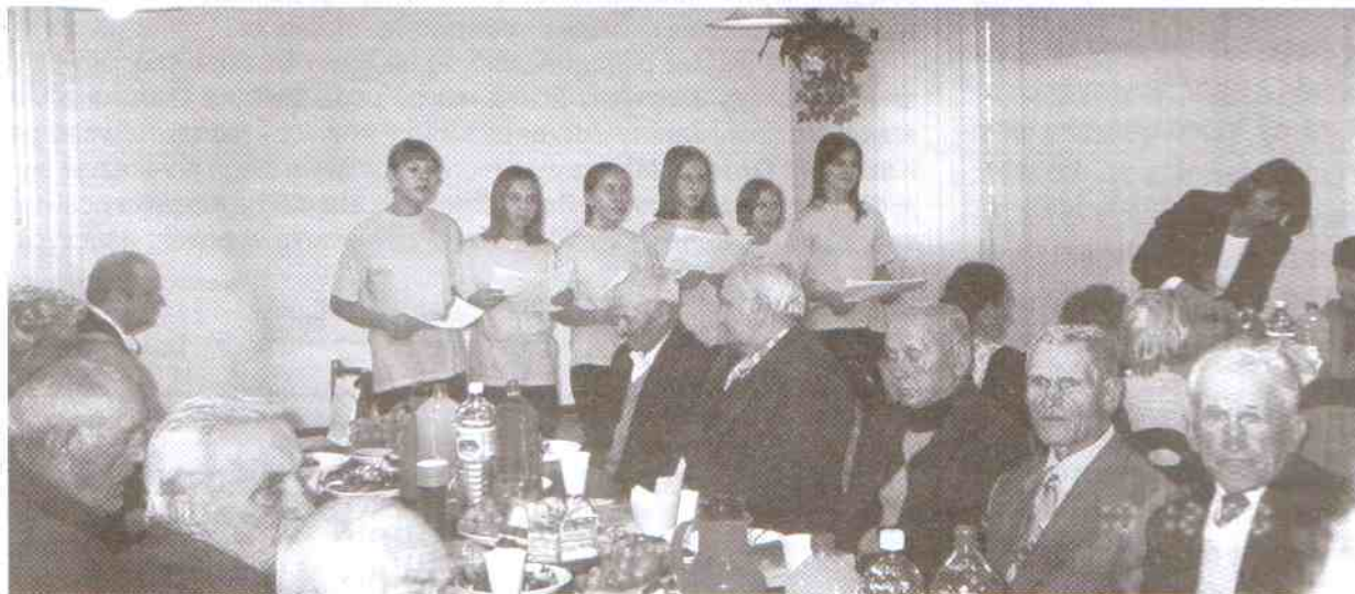
Dziewczęta z Masłowic z nowym repertuarem.