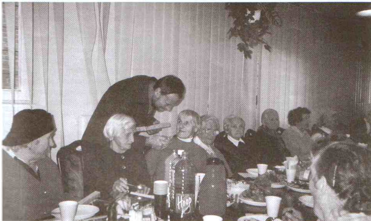
Wszyscy otrzymali piękne bomboniere.