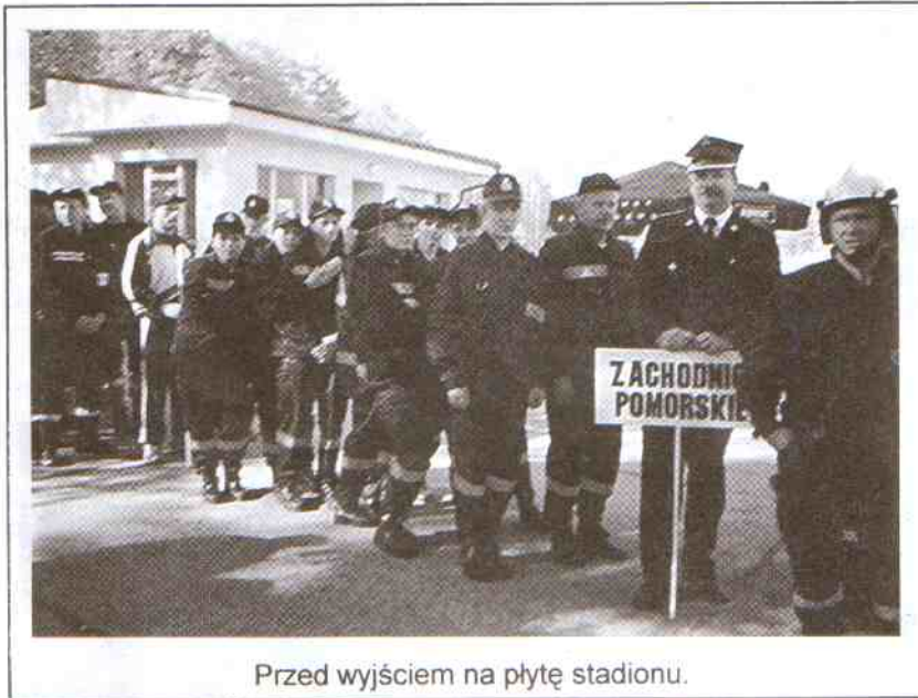
Przed wyjściem na płytę stadionu.

odbyły się X krajowe zawody sportowo - pożarnicze Ochotniczych Straży Pożarnych. Startowała tam także drużyna kobieca z Waszej OSP. Co druh Komendant może powiedzieć na temat przygotowań do tej imprezy?