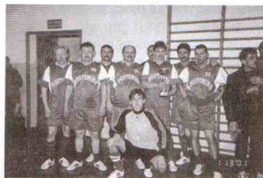
Urząd Gminy Postomino zajął II miejsce.

pracownikom AMGISP i Urzędu Gminy w Postominie, którzy pomogli sprawnie przygotować materiały i przeprowadzić turniej oraz za owocne i kulturalne kibicowanie naszej drużynie.