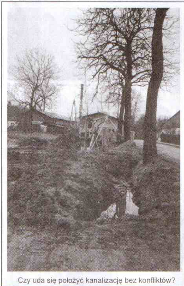
Czy uda się położyć kanalizację bez konfliktów?

Dotychczas kanalizacja osiedla domów wielorodzinnych kierowana była - poprzez teren w tej chwili prywatny - na starą przepompownię, której żywot praktycznie się zakończył. Zaprojektowano, więc lokalizację nowej przepompowni umieszczonej na terenach gminnych. Mieści się ona u zbiegu dróg wojewódzkiej i lokalnej prowadzącej na osiedle. Jej budowa jest praktycznie ukończona. Pozostało do ukończenia ogrodzenie, ale w celu obniżenia kosztów zrobi to już Urząd Gminy we własnym zakresie. Przepompownia ta ma za zadanie odbiór ścieków z osiedla, do którego wybudowaliśmy nową nitkę sanitarną oraz odbiór ścieków z gospodarstw usytuowanych po lewej stronie drogi wojewódzkiej jadąc w kierunku Darłowa, a następnie tłoczyć te ścieki nowowytworzonym kolektorem tłocznym w kierunku oczyszczalni ścieków. Przebieg tras kolektorów w znakomitej większości omija tereny prywatne.