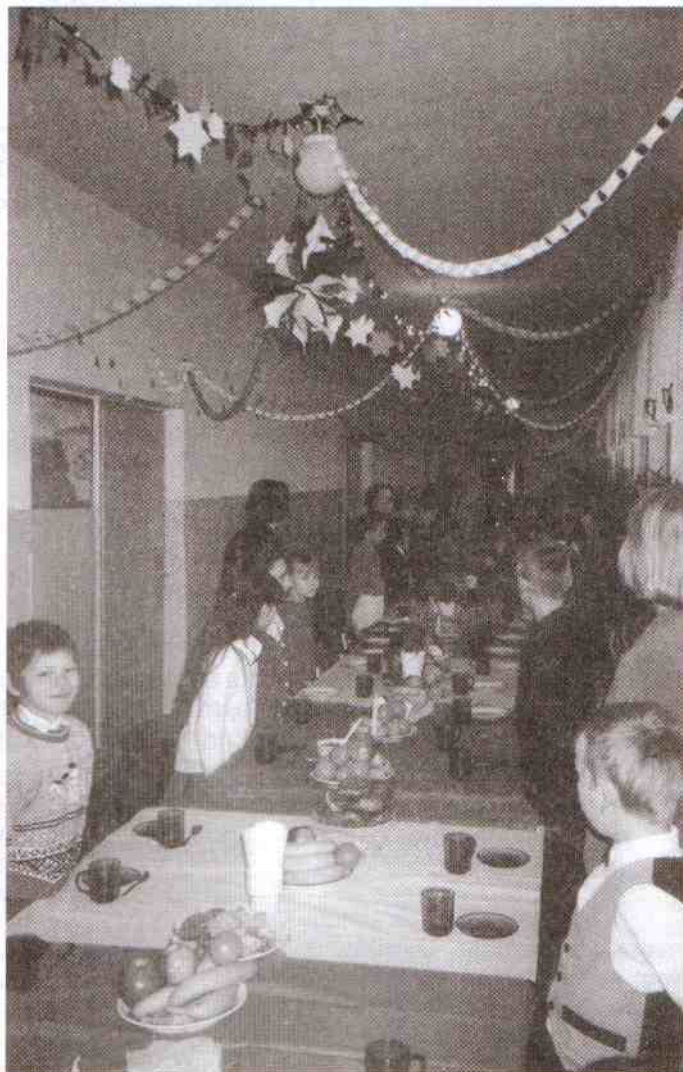
Hol szkolny na chwilę przed pożyciem 12 tradycyjnych posiłków.