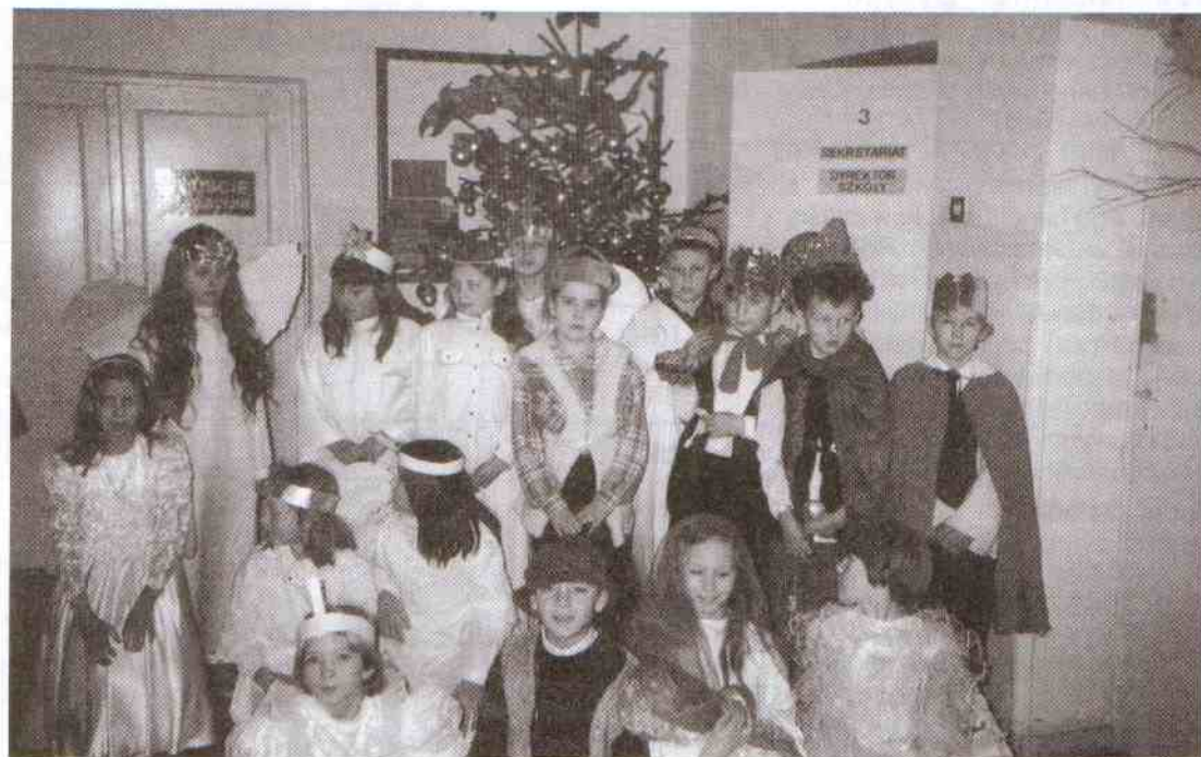
Na zdjęciach grupka przygotowująca szkolne jasełka.