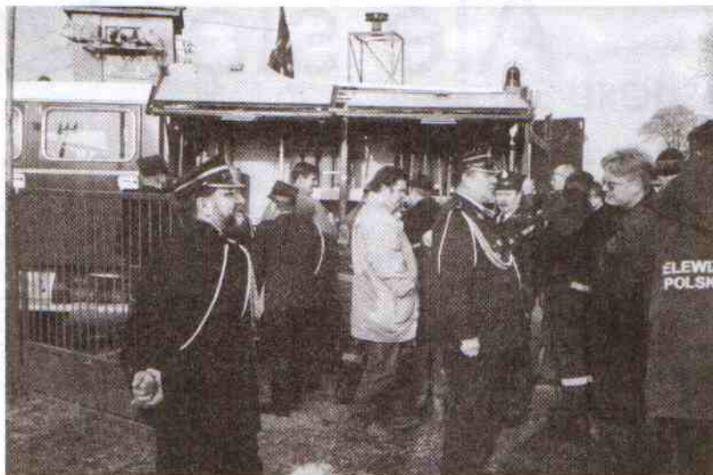
Zainteresowanie samochodem było bardzo duże