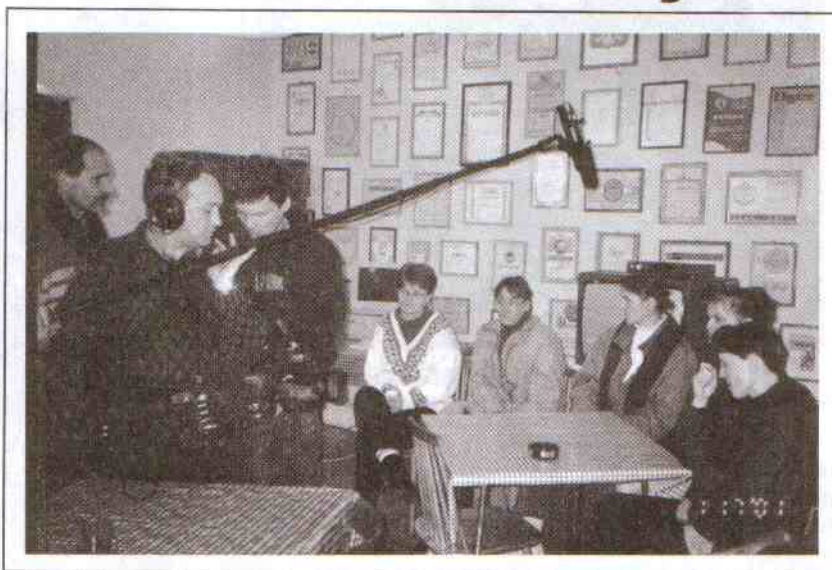
Podczas nagrania z członkiniami Stowarzyszenia Obrony Praw Bezrobotnych.