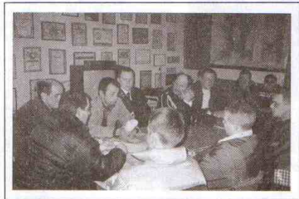
Czy Postomino odzyska swój wóz bojowy? To był dominujący temat.