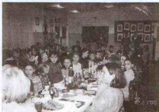
Stół był pięknie zastawiony.

Po złożeniu sobie oplatkowych życzeń dzieci śpiewały kolędy, deklamowały wiersz „O wszystkich miesiącach roku” i wykonały przedstawienie jasełkowe. Na stołach serwowano