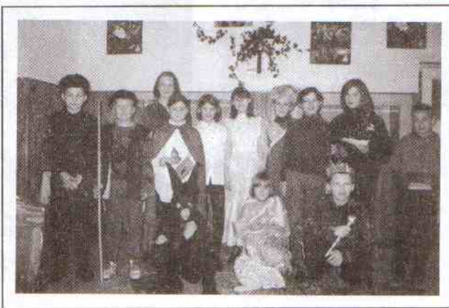
W domu spokojnej starości.