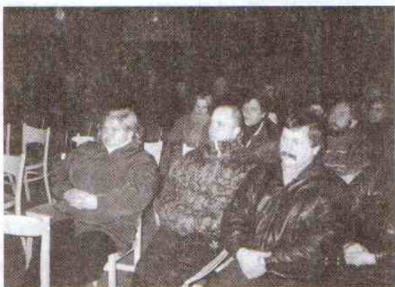
Na sali było ok. 80 osób

scenie politycznej. Wskazywano na zagrożenia, jakie wynikają z bezkrytycznego akceptowania rozwiązań państw zachodnich. Krytykowano politykę rządu w odniesieniu do rolnictwa. Odpowiadając na zarzuty z sali, że Samoobrona nie