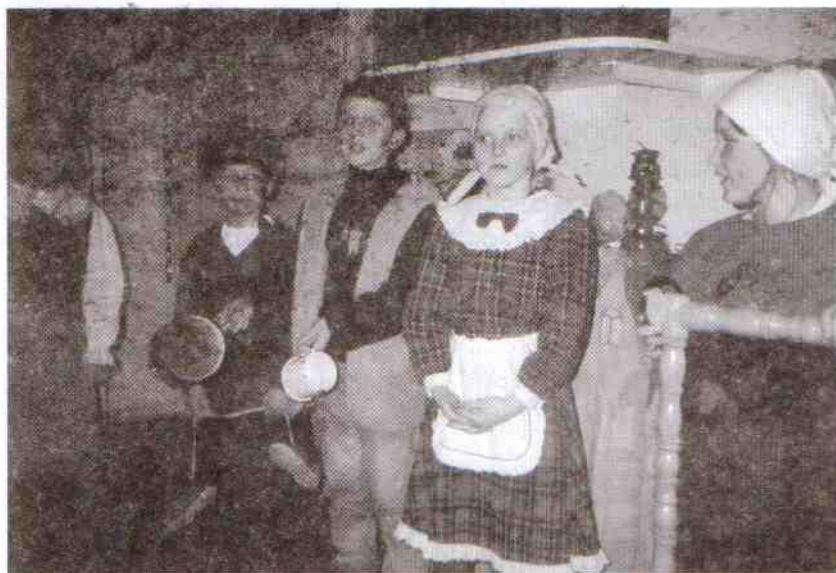
Klasa IV zaprezentowała baśń o Bazyliuszku.