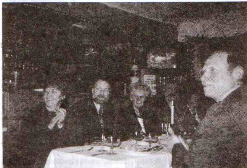
Gorąco oklaskiwano występy „Pieńkowanie”.