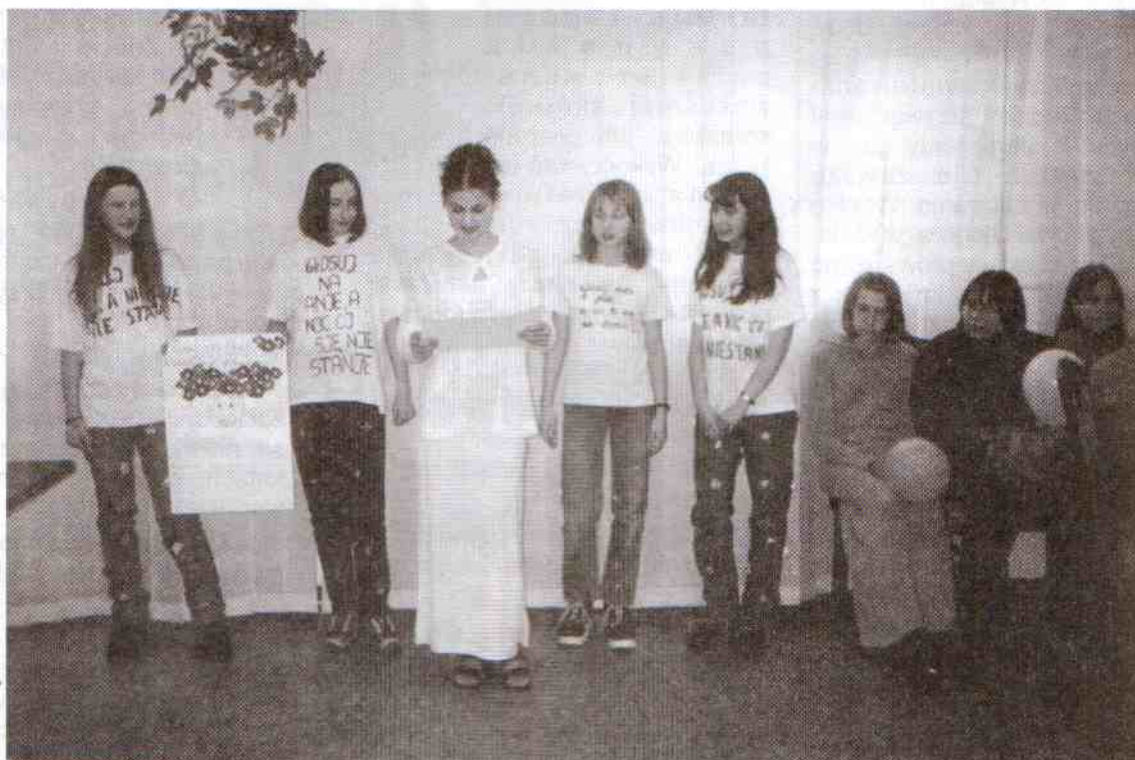
Jeden z komitetów wyborczych