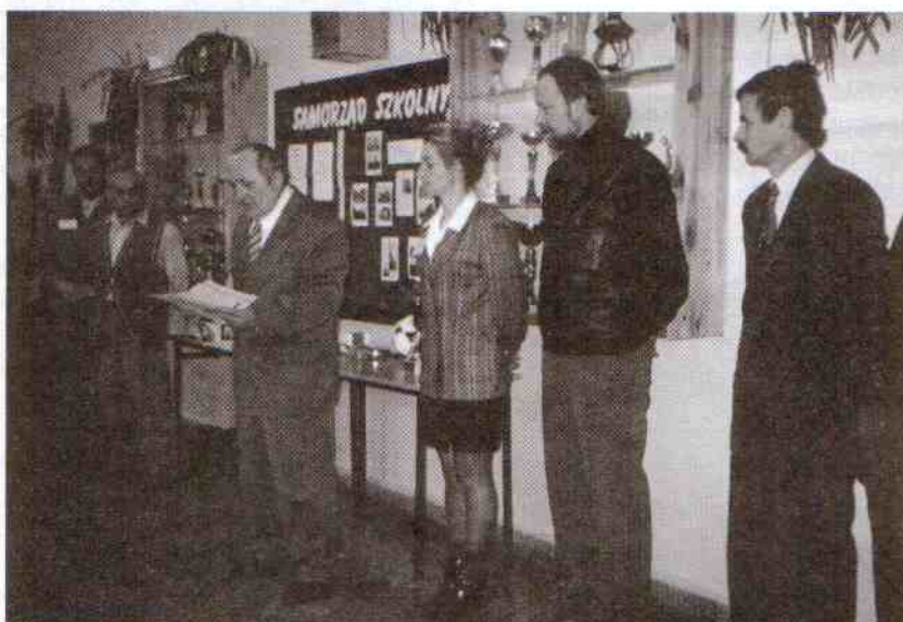
Władze starostwa i gminy uświetniły zakończenie zawodów