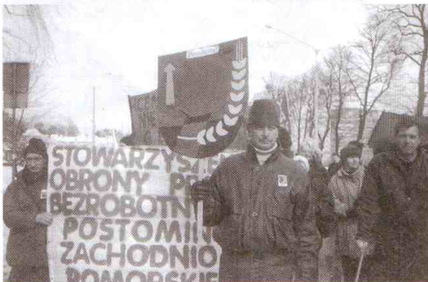
Protest efektów nie przyniósł.