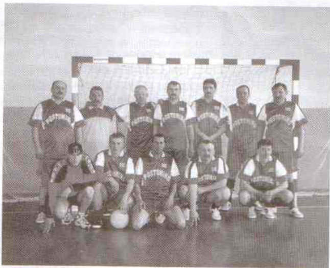
Drużyna z Postomina w pełnym składzie