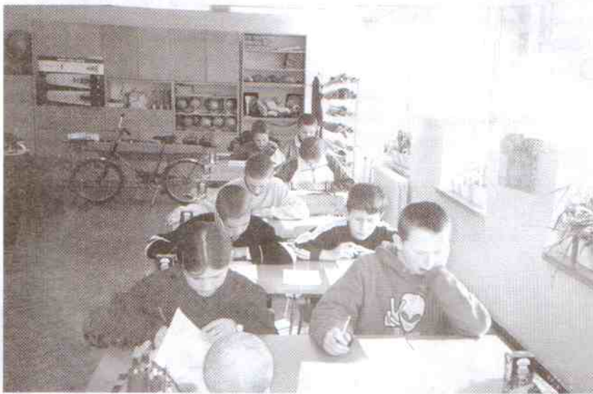
Test nie należał do najłatwiejszych

pomocy oraz wykazanie się umiejętnością jazdy na rowerze, rozegrano 29 marca w Szkole Podstawowej w Postominie.