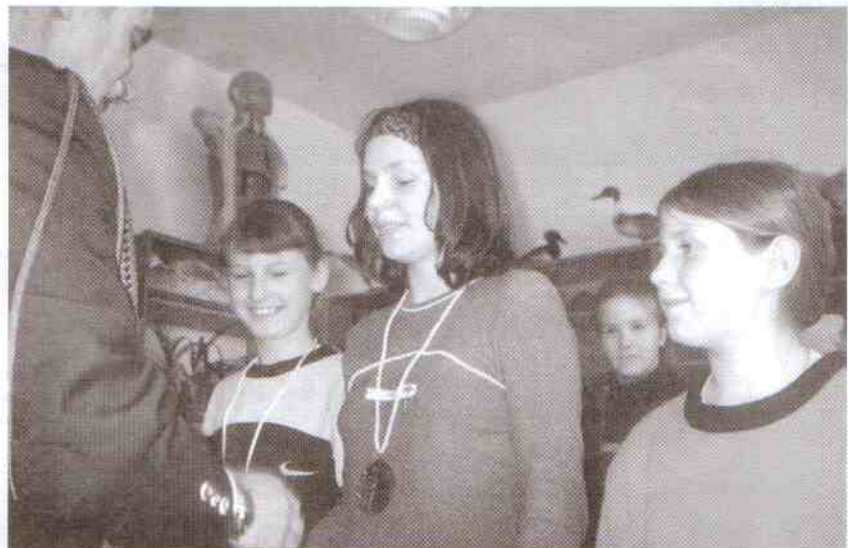
Medal „Król Polowania” zawisł na szyjach korlinianek

musieli wykazać się wiedzą na temat pojęć przyrodniczych, znajomością zwyczajów i słownictwa z zakresu myślistwa, rozpoznawali gatunki drzew iglastych i liściastych oraz zwierzęta łowne.