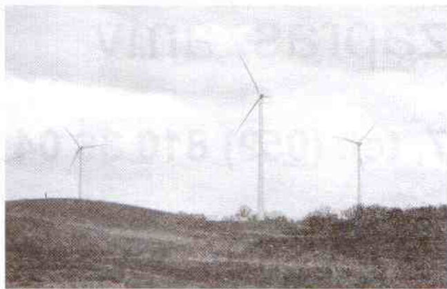
Wiatraki pod Dzierżęcinem