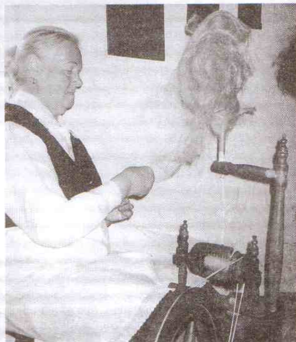
Nie do wiary, ale lniana nić była niezwykle równa.