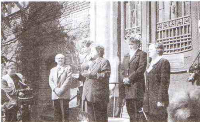
Liderzy Stowarzyszeń Obrony Praw Bezrobotnych z trudem opanowywali emocje protestujących

protestujący, jak i samorządowcy, którzy na co dzień borykają się z bezrobociem i walczą o pieniądze w celu jego złagodzenia, stanęli przeciwko sobie. Gorzkich żalów i okrzyków dezaprobaty wysłuchał więc z