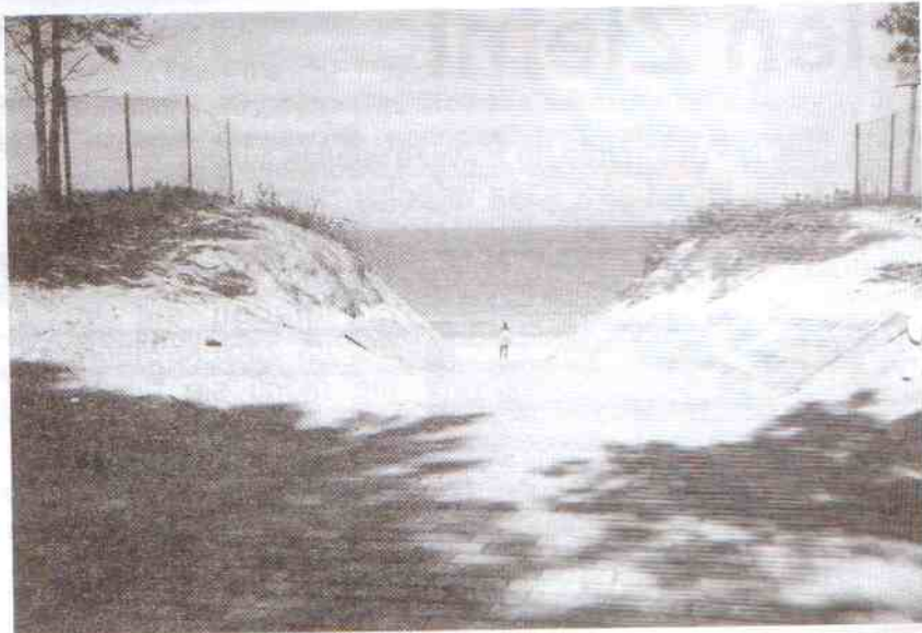
Nowe zejście dla niepełnosprawnych