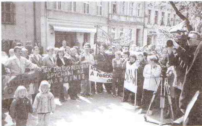
Okolo 150 osób wyrażało swoje niezadowolenie

Przed Urzędem Miejskim w Sławnie demonstrowali bezrobotni z regionu sławieńskiego. W tym samym czasie, w auli konferencyjnej, samorządowcy wraz z przewodniczącymi lokalnych stowarzyszeń obrony praw bezrobotnych z dezaprobatą wysłuchiwali co ma do powiedzenia urzędnik z Wojewódzkiego Urzędu Pracy w Szczecinie, a do powiedzenia miał niewiele. Z zapowiadanych przedstawicieli władz centralnych nie przyjechał ani minister pracy Longin Komolowski (ponoć tego dnia ważniejsi byli „laweciarze”), ani prezes Krajowego Urzędu Pracy. Nie było też posłów ani senatorów. Sytuacja stała się więc paradoksalna, bo zarówno