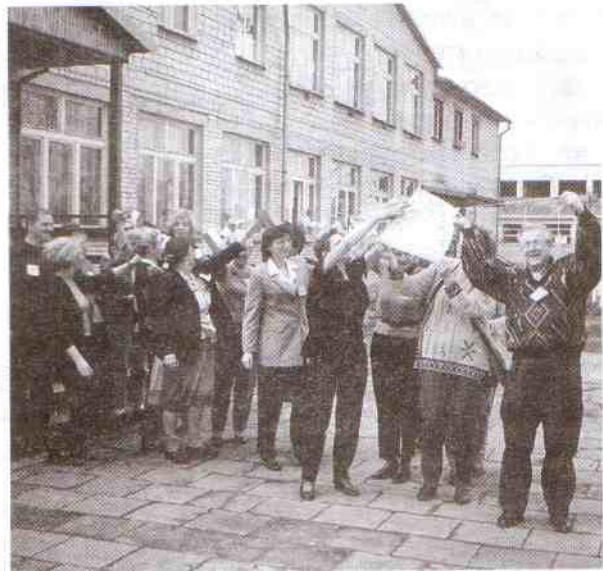
Liczne gry ruchowe, integrujące grupę, były miłym akcentem w zajęciach

Nieliczna, (bo tylko 27 osobowa), grupa nauczycieli szkół podstawowych i gimnazjum skorzystała z możliwości uczestniczenia w projekcie wychowawczym pn. „Trzy Koła”. Program ten uzyskał pozytywną opinię Polskiej Fundacji Dzieci i Młodzieży, do której zwróciła się dyrekcja SP Postomino z wnioskiem o dotację. Wniosek został przyjęty i nauczyciele mogą - nie tracąc