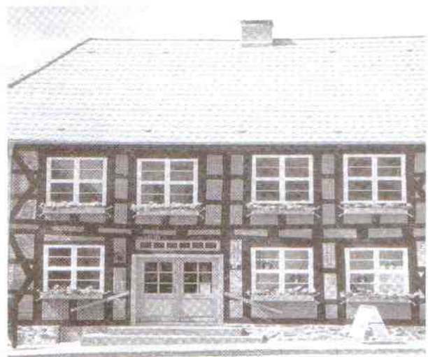
Dom młynarza z 1742 r.