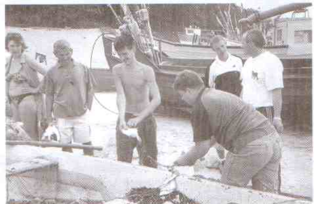
W Jarosławcu można kupić flądrę prosto z burty.