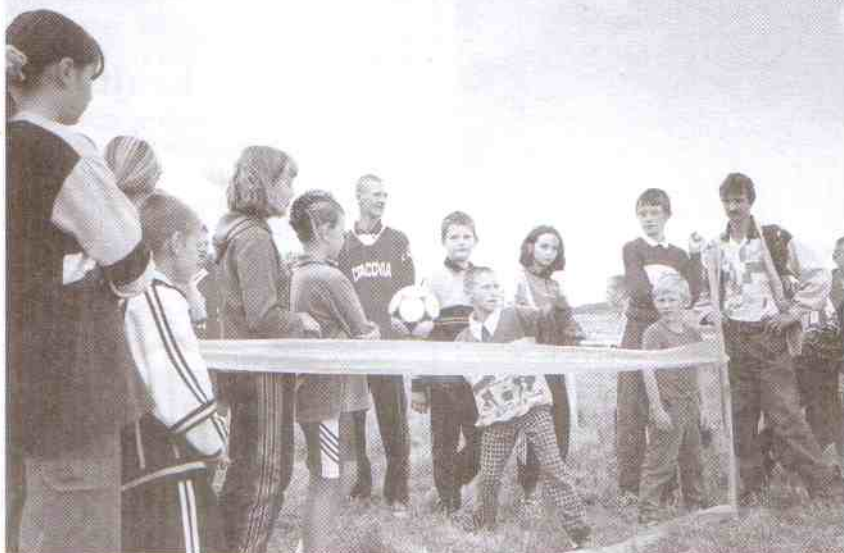
Trafienie piłką w cel nie było wcale taką prostą sprawą.

- Przewodnią myślą festynu jest wypoczynek bez alkoholu. Bardzo dobrze, że lokalne społeczności