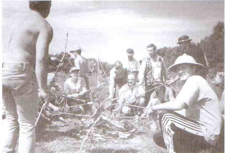
A po zawodach wspólne ognisko z kielbaskami