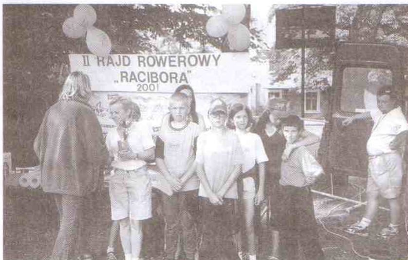
Najliczniejszą grupą był klub „Apogeum” z Postomina.

rowerzystów, którzy w sobotę przejechali trasę 40 km, zaczynając od Rusinowa, Naćmierza, Bylicy drogą leśną do Dzierzęcina, następnie przez farmę wiatrową w Barzowicach do Palczewic, Kopania, Cisowa, Darłówka, a potem trasą wzdłuż morza obok jeziora Kopań, przez Wicie do Jarosławca. W niedzielę była druga trasa o długości 26 km. Wyjeżdżając z Jarosławca uczestnicy rajdu skierowali się na Jezierzany, Łącko, Korlino, Królewo, Marszewo (jezioro), Górsko i wrócili przez poligon wojskowy do Jarosławca. Rajdowicze zwiedzili farmy wiatrowe Barzowice i Cisowo, podziwiano z Góry Barzowickiej wspaniały widok na jezioro Kopań i