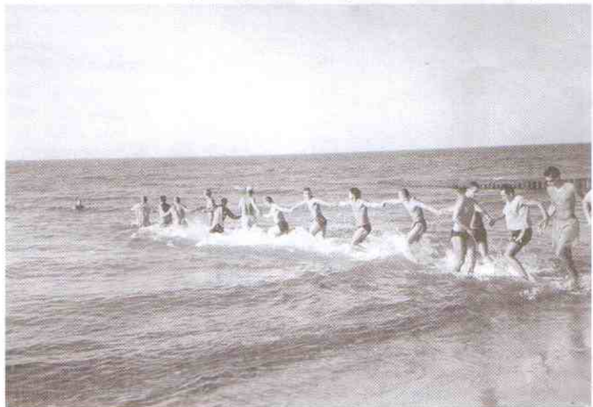
Jeden ze sposobów ratowania tzw. "lina z ratowników".

nie mamy wpływu na wypadki w rejonie poligonu wojskowego, bo tam ludzi być nie powinno! Dla przykładu dzisiaj (15.08.) mamy pierwsze w tym sezonie utonięcie i to właśnie w tamtym rejonie. Utonęła pięcioletnia dziewczynka, która chodziła po podwójnych ostrogach, potknęła się i utknęła między palami ok. 1 km od naszych stanowisk. Taka odległość sprawia, że czas powiadomienia nas o wypadku i czas na dotarcie do miejsca zdarzenia są zbyt długie, aby akcja ratownicza zakończyła się