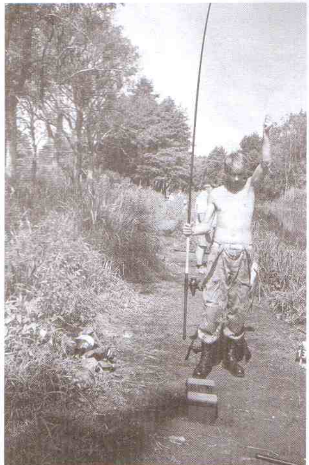
Tego dnia na stanowisku nr 13 też brały ryby.