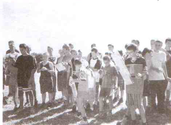
Najlepsi piłkarze turnieju z zainteresowaniem oglądają swoje nagrody