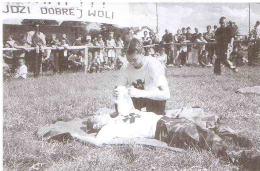
Pokaz udzielania pierwszej pomocy przez harcerzy „Łódź-Widzew”

Pod takim hasłem Stowarzyszenie Rozwoju Regionu Jarosławiec zorganizowało w tym roku już po raz drugi wielogodzinny maraton imprez rozrywkowych dla wczasowiczów i mieszkańców okolicznych miejscowości.