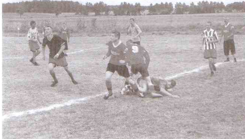
Mecze były zacięte.

wzmocnione były zawodnikami m.in. z Marszewa i Naćmierza. Pierwsze miejsce zajęła drużyna złożona z zawodników Mazowa i