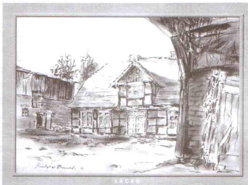
Dom szachulcowy. Radosław Berek, pastel (42×29)