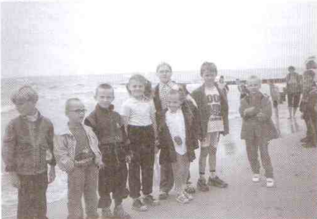
Przyjemny pobyt nad Bałtykiem pozostawił dużo wrażeń.