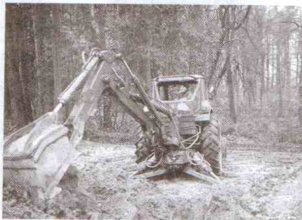
Po wykopach teren trzeba wyrównać i uporządkować.

Wójt - Andrzej Kruczkowski przedstawił wszystkie aspekty i uwarunkowania związane z realizacją tej inwestycji oraz koniecznością partycypacji