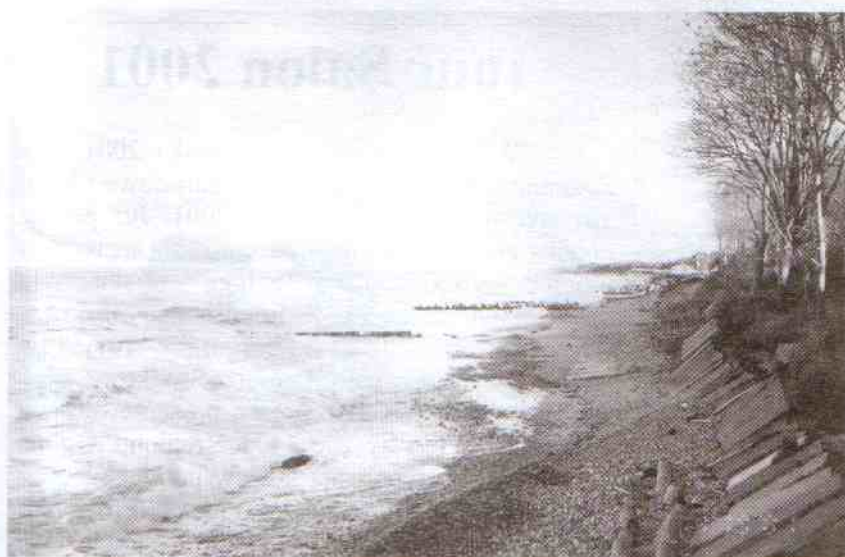
Refulacja piasku na plażę w Jarosławcu byłaby bardzo kosztowna, a efekty mogą być mizerne. Nie mniej trzeba znaleźć jakieś rozwiązanie

interwencyjnych wymagała ściślejszej ich kontroli i zwiększenia obowiązków pracowników AMGiSP.