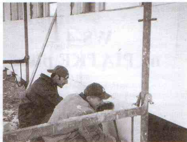
Trwają prace dociepleniowe przy Szkole Podstawowej w Postominie.

Z małymi przerwami z uwagi na niekorzystne warunki atmosferyczne (obfite