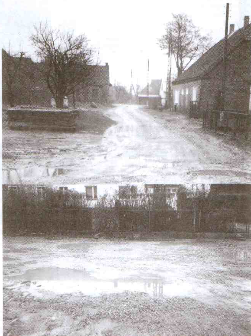
Tak wyglądała uliczka po wykonanej „naprawie”