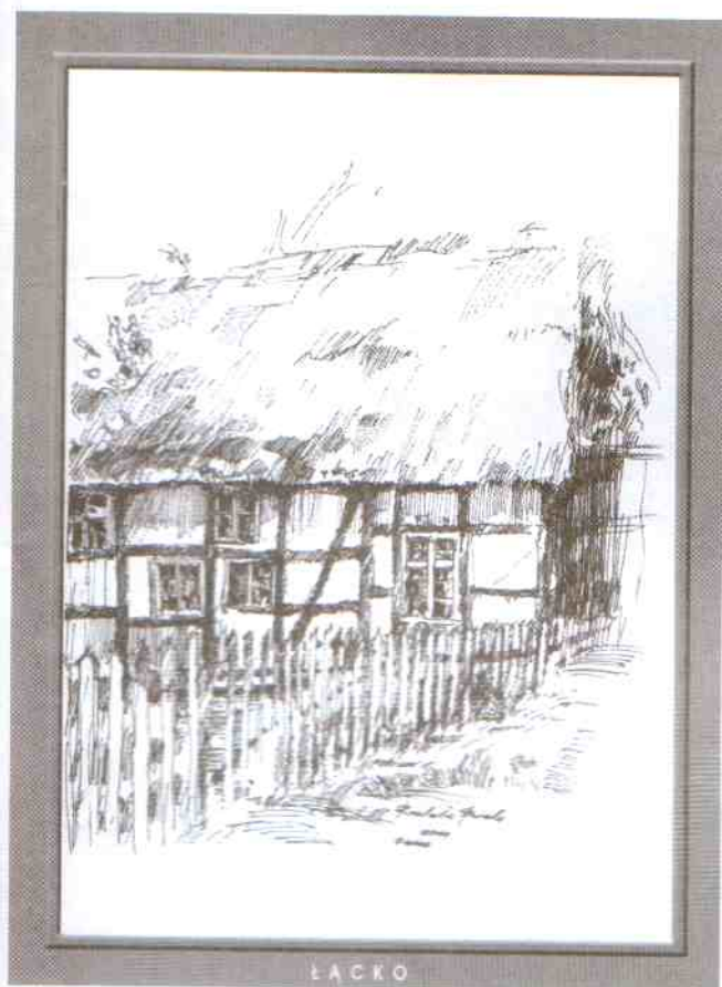
Dom pod strzechą