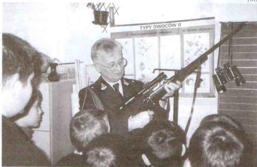
Prawdziwy sztucer z prawdziwą lunetą

Rozmawiano o szkodnictwie społecznym, jakim jest kłusownictwo stanowiące w niektórych regionach kraju wręcz plagę. Zwierzęta łapane w stalowe wnyki giną w okropnych męczarniach z głodu, pragnienia i zakażenia organizmu. Ale rozmawiano też i o gospodarce łowieckiej,