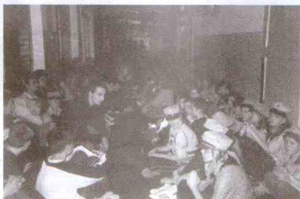
Na zdjęciach: z życia rajdowego obozowiska.