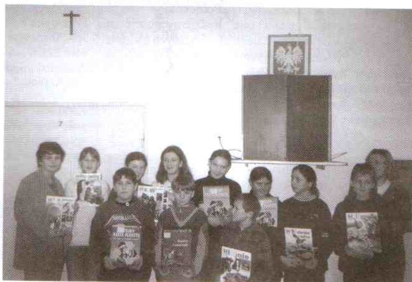
Wyróżnieni autorzy prac w grupie.