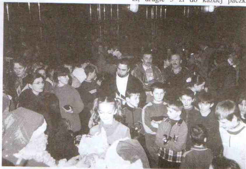
Paczkę od Mikołaja przyjmuje się z dreszczykiem emocji.