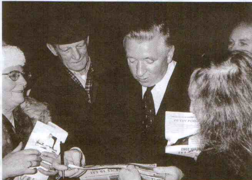
Po spotkaniu A. Lepper podpisywał książkę swojego autorstwa. Rozdawano też czsopismo Samoobrony „Za miedzą”

O sobie: Mam poglądy lewicowe, ale zdrowe.