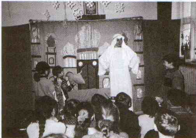
Spektakl „Lampa Alladyna”

Już od kilku lat w okresie ferii zimowych działa w naszej szkole świetlica środowiskowa. Frekwencja na tegorocznych zajęciach była rekordowa i wynikała z bogatego i ciekawego programu, który zakładał rozwijanie zainteresowań kulturalnych uczniów oraz rozbudzanie nawyku obcowania ze sztuką.