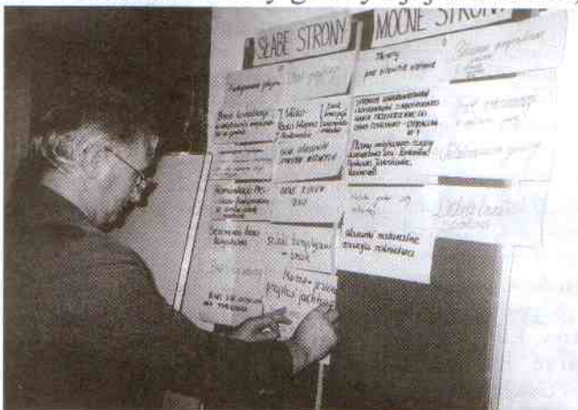
Słabych stron było więcej

Uczestnicy na zasadzie burzy mózgów musieli w podzespołach określić mocne i słabe strony gminy i jej otoczenia,