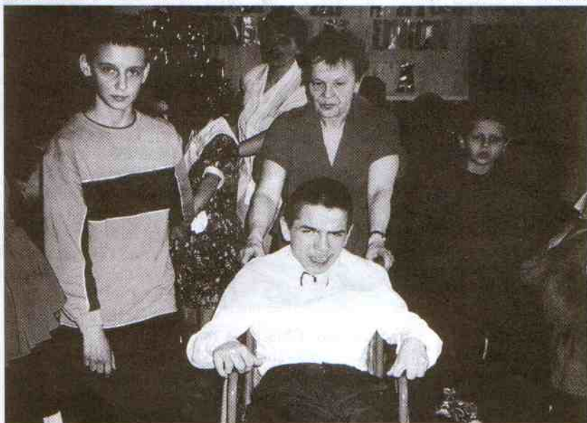
W dobrowolnym towarzystwie można tańczyć nawet na wózku

pogoda prawdziwie wiosenna - w centrum wsi słychać muzykę, głos wodzireja. To bawią się dzieci uczęszczające do świetlicy politechnicznej i uwaga... dzieci rodziców, którzy szkolą się na wolontariuszy. Do zabawy, konkursów zagrzewa rewelacyjny