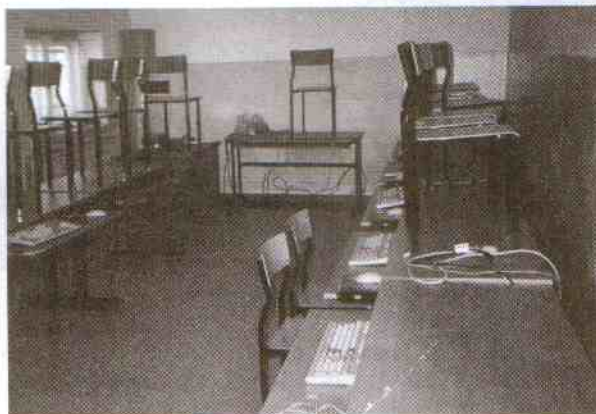
Wygląd pracowni po kradzieży

Dyrektor: Pomieszczenie pracowni było solidnie okratowane zarówno na zewnątrz jak i przed drzwiami pracowni. Zresztą taki był wymóg fundatorów, którzy sprawdzili zabezpieczenia przed przekazaniem komputerów. Pracownia posiadała alarm, który jak wiemy dzisiaj zadziałał i dlatego został przez złodziei przerwany.