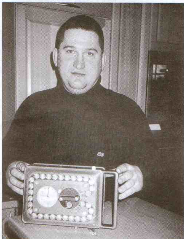
Specjalny zegar rejestrujący czas powrotu gołębi z „lotu”