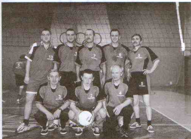
Ugorski z Postomina.

Dla sołectwa Marszewo przeprosiny od organizatorów za mylne przesunięcie w klasyfikacji końcowej. Zajęte siódme miejsce jest zaszczytem przy tak wyrównanej grze, jaką prezentują sołectwa. Zaważyły tzw. małe punkty. Tak też bywa - gracie wspaniale.