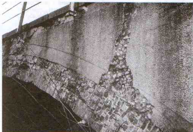
Widok mostu od strony Marszewa

Most na drodze wiodącej z Postomina do Marszewa ma się coraz gorzej. Na jego bocznych ścianach widać duże ubytki i pęknięcia. Podobne pęknięcia są na sklepieniu zbudowanym z cegieł. Mieszkańcy Marszewa i Górska twierdzą, że przyczyną postępującej dewastacji drogi i mostu są ciężkie transporty wojskowe, które tędy podążają w kierunku poligonu. Ładunki wielokrotnie przewyższają nośność mostu. Strach pomyśleć, co się stanie, gdy trzeba będzie go zamknąć. Żeby dojechać z północy gminy do Postomina trzeba by nadłożyć dodatkowych kilkanaście kilometrów.