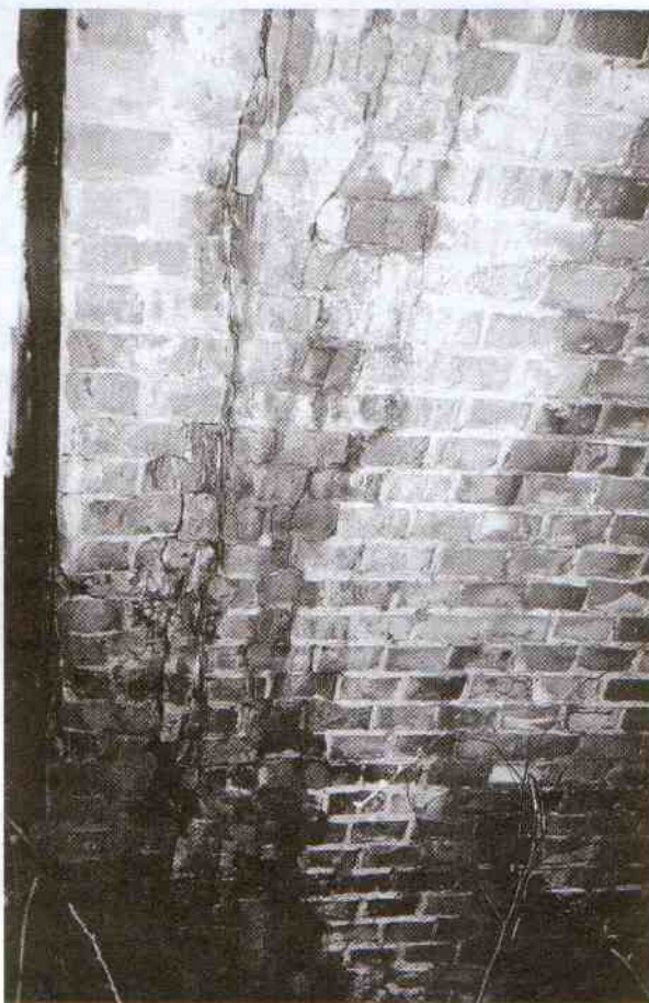
Wyraźne głębokie pęknięcie na sklepieniu mostu

Zarząd Dróg Publicznych w Sławnie wystąpił do Generalnej Dyrekcji Dróg Publicznych o pomoc w pozyskaniu środków na remonty dróg o dużym nasileniu ruchu jednostek ponadnormatywnych, jakimi są pojazdy wojskowe i transporty podążające na poligon Wicko. Generalna Dyrekcja z urzędniczą nonszalancją wrzuciła ramionami odpowiadając, że brak jest podstaw prawnych do przydzielenia dodatkowych środków finansowych na utrzymanie takich dróg. Warszawa nie pochyliła się nad problemem. Warszawa problemu w ogóle nie widzi odpowiadając. „Z uwagi na niewielką (sic! - dop. red.) częstotliwość przejazdów można założyć, że ruch kolumn wojskowych po drogach samorządowych odbywa się w