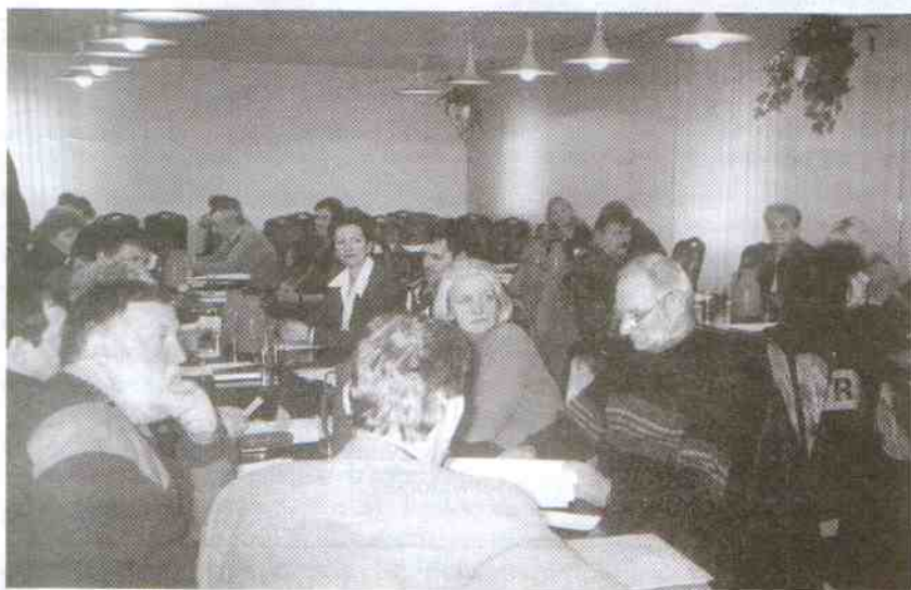
Z całą pewnością były to efektywnie wykorzystane godziny

Radni, dyrektorzy szkół i urzędnicy stanowili główny trzon zespołów opracowujących założenia do Strategii Rozwoju Gminy Postomino.