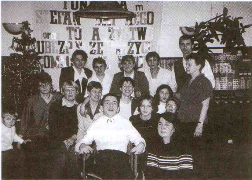
Wolontariusze - swoją pracę, czas i energię postanowili poświęcić innym