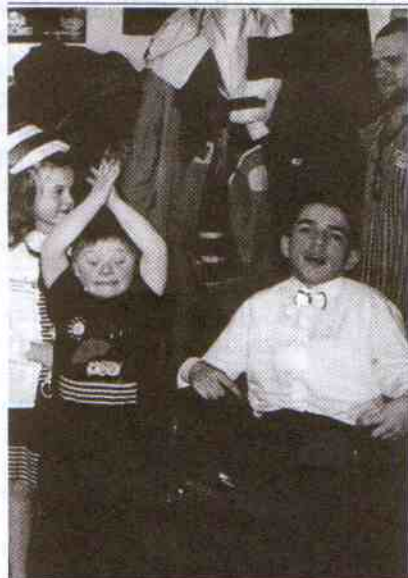
Radość z odniesionego sukcesu