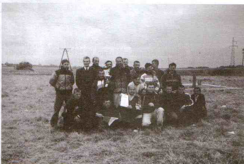
Zwycięska drużyna turnieju piłki nożnej z władzami gminy Postomino

więzi pomiędzy sąsiadującymi ze sobą gminami: Postomino, Sławno, Darłowo. Główną atrakcją były mecze piłki nożnej. Gminę Darłowo reprezentowała drużyna z Kowalewic, która zwyciężyła w turnieju i zdobyła puchar Wójta Gminy Postomino. Gminę Postomino reprezentowali zawodnicy z Kanina, Mazowa i Wilkowic i zajęli II miejsce. Drużyna ze St. Krakowa (gmina Sławno) zajęła