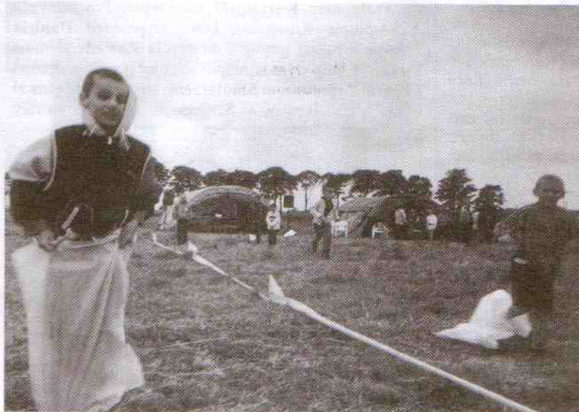
Bieg w workach - atrakcja dla najmłodszych