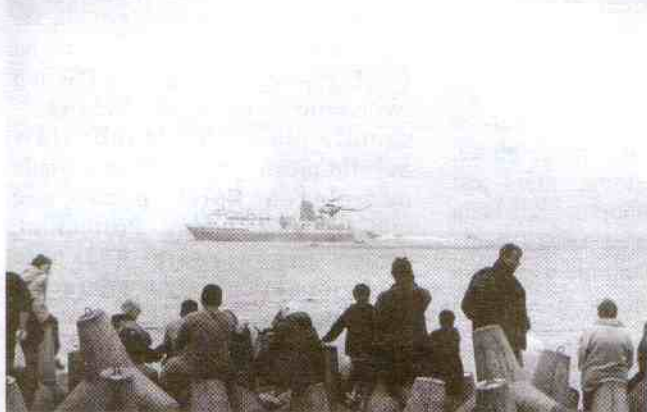
Pokaz ratownictwa morskiego w Jarosławcu.