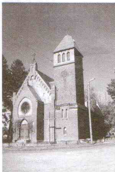
12 Szept Postomina