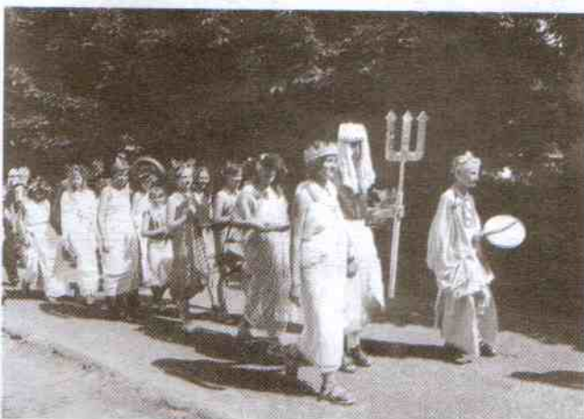
... tuż obok defilował orszak Neptuna.