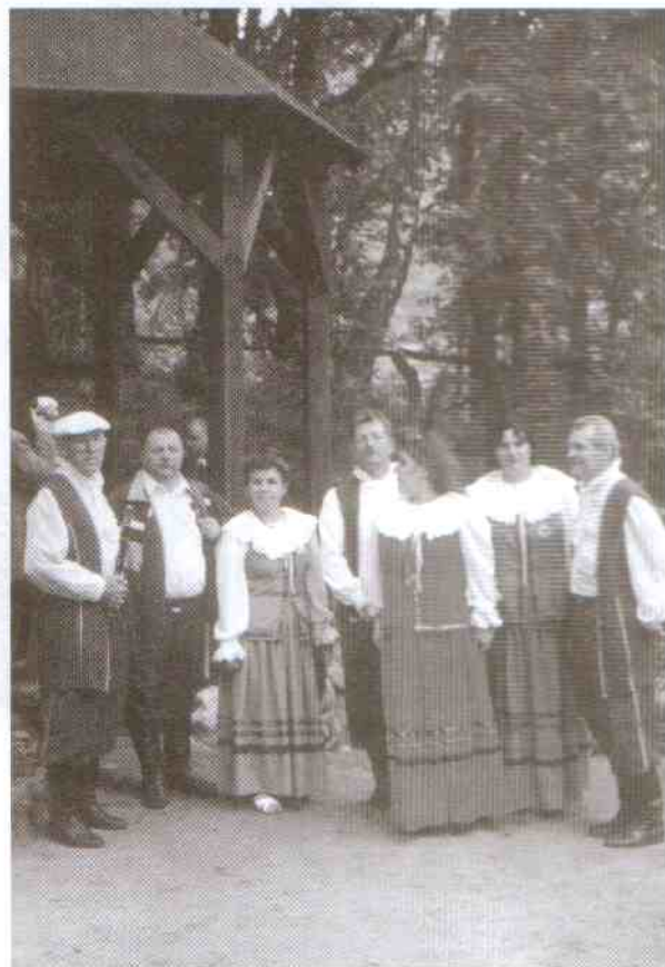
„Pieńkowanie” przed legendarnym źródłem wody uzdrawiającej w Polanowie