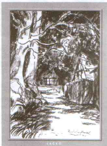
Łącko. Uliczka. Radosław Barek (pastel 42×29)

W imieniu organizatorów serdecznie zapraszamy do Postomina