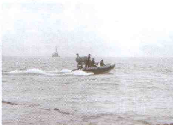
Te łódzie mogą prowadzić akcję ratowniczą w każdych warunkach

W sobotę 20 lipca wczasowicze z Jarosławca i okolic obejrzeni pokazy ćwiczeń ratowniczych na pełnym morzu. Statek naukowo-badawczy „Nawigator XXI” Wyższej Szkoły Morskiej w Szczecinie zbliżył się do wybrzeża naprzeciwko punktu widokowego w Jarosławcu. Scenariusz ćwiczeń przewidywał ewakuację ze statku na tratwy ratownicze oraz podejmowanie rozbitków z morza. W pokazach uczestniczyła załoga śmigłowca ratownictwa morskiego z Darłowa, statek ratowniczy „Zefir” oraz szybkie kutry ratownicze SPEED BOWL, które mogą prowadzić akcję ratowniczą w każdych warunkach