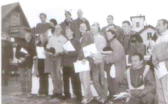
Satysfakcja z ukończenia biegu była duża.