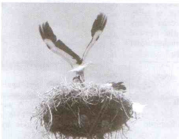
Nauka latania w wykonaniu „łackich” bocianów.