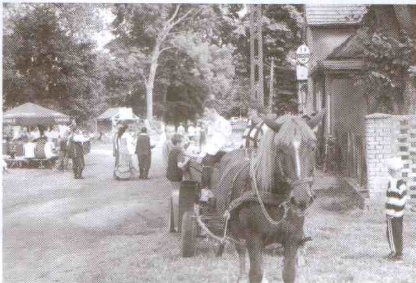
Dla kolonistów z Jarosławca przejażdżka bryczką była atrakcyjna

Organizatorzy festynu zadbali też o dodatkowe atrakcje. Zaproszono niezawodny zespół „Pieńkowianie”, który umiał widzom pobyt. Było stoisko ze słodkimi wypiekami, chleb ze smalcem i ogórkiem małosolnym,