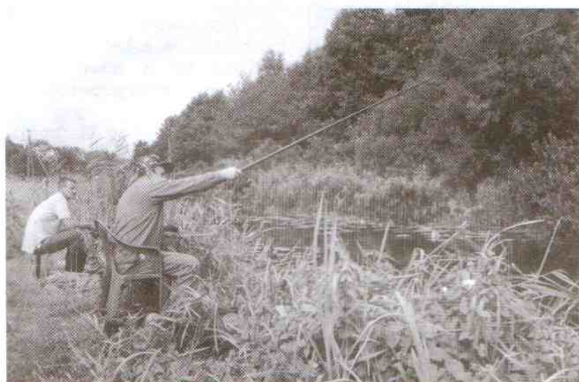
Nie pomogły zakłęcia. Ryby brać nie chciały.