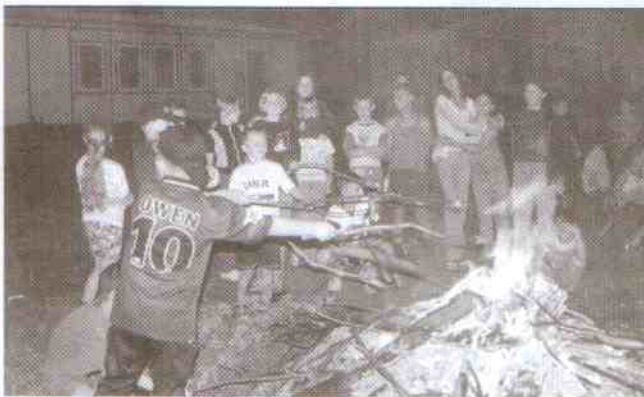
Przy ognisku na kolonii w Ośrodku Bryza w Jarosławcu

Pogoda może trochę zawiodła, ale humory i tak dzieciom dopisywały. Dzięki kadrze obozu młodzież miała mnóstwo gier i zabaw oraz innych zajęć, między innymi zajęcia profilaktyczne. Dzieci korzystając z różnego rodzaju propozycji, poznawały sposoby i znaczenie dla ich życia aktywnego stylu życia, zasady dbania o codzienną higienę oraz wyrabianie nawyków właściwej organizacji planowania dnia. Wróciły zdrowe i wypoczęte.