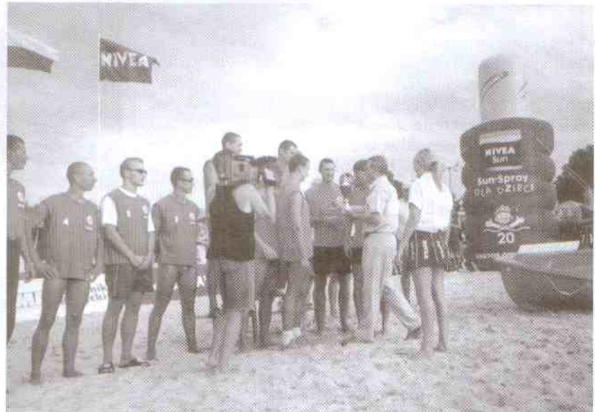
Kwalifikacje w Ustce wygrało Postomino. Ratownicy z Jarosławca odbierają gratulacje od Burmistrza Ustki.

Kolejny dzień zawodów rozpoczął bieg na dystansie 1000 m