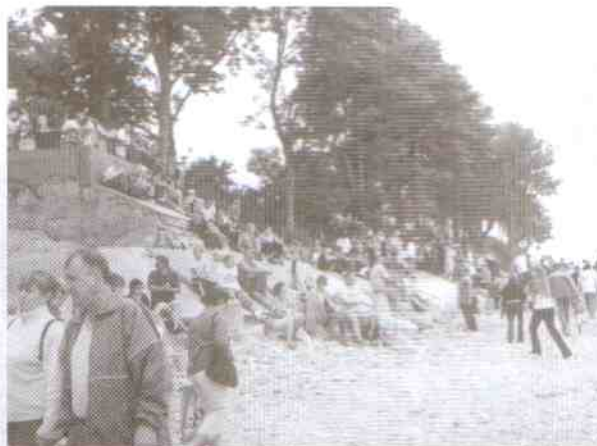
Pokazy oglądały setki widzów

pogodowych. Dla WSM była to popularyzacja wydziału ratownictwa morskiego. Dla wczasowiczów z Polski i mieszkańców gminy była to niesamowita atrakcja.