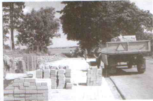
Dobiegła końca budowa parkingu przy cmentarzu w Chudaczewie.