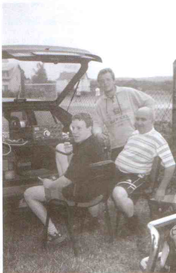
Operatorzy radiostacji klubowej SP1KIZ w czasie kolejnych zmagania „eterowych”

Zarząd Główny Ligi Obrony Kraju opublikował wyniki zawodów krótkofalarskich o mistrzostwo Polski radiostacji klubowych za I półrocze 2002 r. Ekipa klubowa sekcji łączności KS „Przełom” Postomino zajmuje czołowe miejsca tego współzawodnictwa. W konkurencji UKF zajmuje I miejsce na 44 ekipy, w konkurencji nasłuchowej zajmuje I miejsce na 10 ekip, w konkurencji łącznej KF zajmuje V miejsce na 68 ekip, w konkurencji telegraficznej KF zajmuje IV miejsce na 70 ekip, w konkurencji fonicznej KF zajmuje VIII miejsce na 107 ekip. Znosi się więc na to, iż krótkofalowcy z Postomina powtórzą ubiegłoroczny sukces, zdobywając kolejne tytuły mistrzowskie Polski.