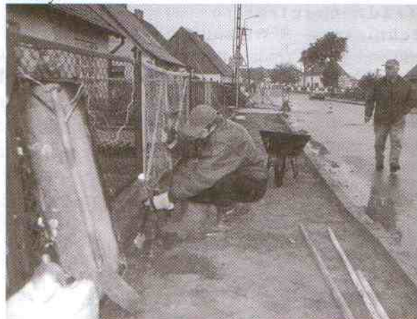
Ostatnie prace przygotowawcze przed położeniem kostki na chodniku w Postominie

Budowa oświetlenia w m. Łęzek i Chudaczewko zapewni większe bezpieczeństwo na drodze, szczególnie dla dzieci uczęszczających do szkoły.