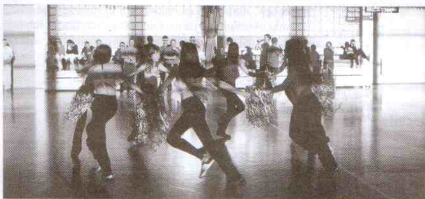
Anglicy byli zachwyceni występami dziewcząt z zespołu tanecznego.