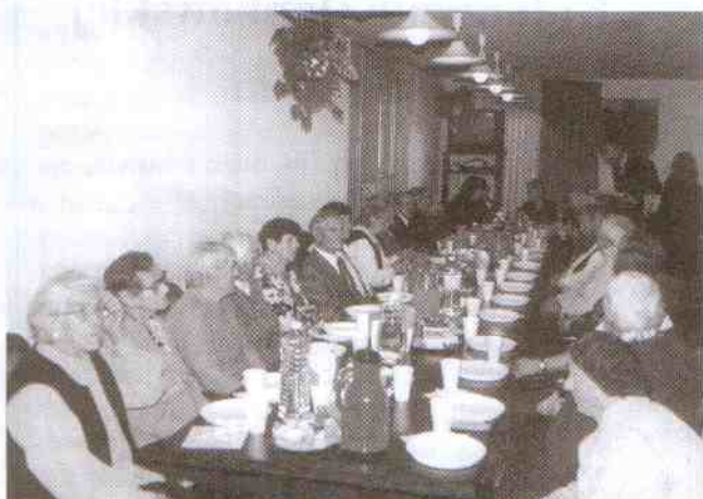
Na spotkanie w Urzędzie Gminy przybyło 41 osiemdziesięciolatków

zebranych stwierdził, że wiek dojrzały jest następstwem życia za młodu. - Ile włoży się w swoje życie, tyle na starość się otrzyma. Człowieka starszego nie trzeba czytać - wystarczy go widzieć. Z kolei los