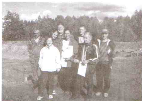
„Rodzinne” drużyny Przełomu I, II i „Cyranki”.

Na dwadzieścia dwie ekipy strzeleckie z powiatu