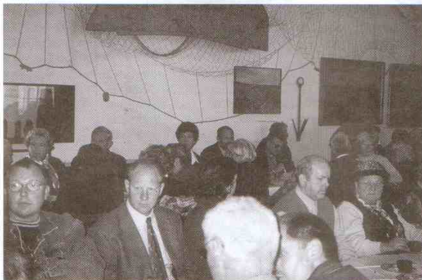
Spotkanie w Zamku Książąt Pomorskich w Darłowie