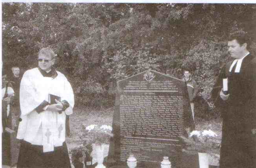
Odsłonięcie pomnika na cmentarzu w Łącku

Na zakończenie spotkania obie strony, wyraziły pełną satysfakcję ze wspólnie przeżytego dnia.