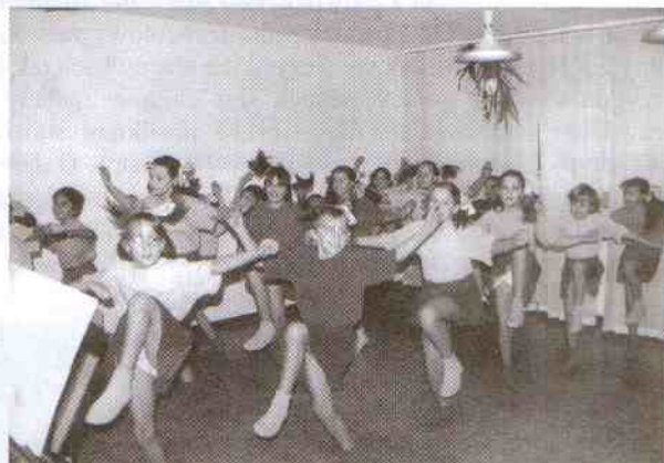
Roztańczone dziewczęta bawiły zebranych

zebranych stwierdził, że wiek dojrzały jest następstwem życia za młodu. - Ile włoży się w swoje życie, tyle na starość się otrzyma. Człowieka starszego nie trzeba czytać - wystarczy go widzieć. Z kolei los