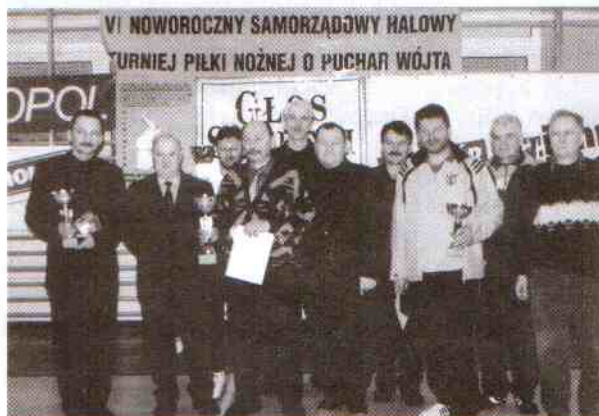
Pamiątkowe zdjęcie władz samorządowych Darłowa, Kobylnicy, Malechowa, Postomina, Słupska i Ustki