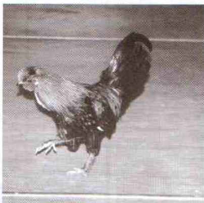
Za sprawą uczniów z Pieszcza ten kogucik zasilil konto WOŚP o kolejne 27 zł

puzzle, zabawki, przytulanki, płyty kompaktowe, słodycze, żywego lilipuciego kogucika i