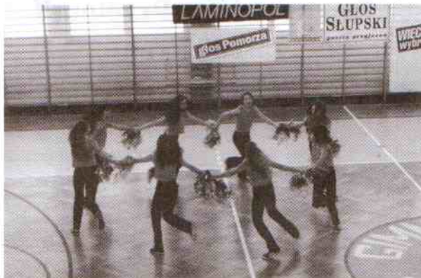
Dziewczęta z gimnazjum za swoje występy zebrały liczne brawa

Grzegorz Pakos (4 bramki). Zespoły zaprezentowały dużą wolę walki. Na boisku oglądaliśmy wiele składnych