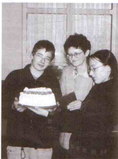
Ten okazały tort wyceniono na 102 złote!

wiele mniej lub bardziej przydatnych przedmiotów.