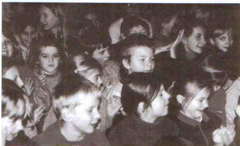
Atmosfera na sali była niezwykle gorąca