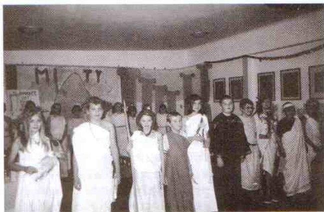
Na zdjęciu plejada bogiń i bogów greckich z V b. (ryt.)