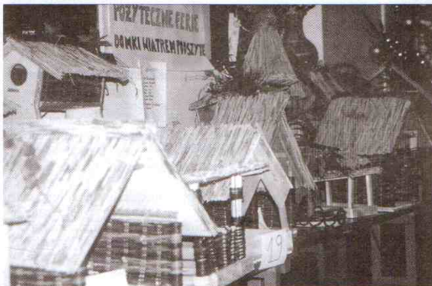
W budowę domków dzieci włożyły dużo pomysłów i pracy

14 lutego na świetlicy wiejskiej w Postominie urządzono zabawę dla blisko 80 dzieci, która była jednocześnie uroczystym zakończeniem programu „Pożyteczne ferie”. Każde z dzieci otrzymało paczkę wartości 10 zł ufundowaną przez Starostwo Sławińskie a kulminacyjnym punktem programu było ogłoszenie wyników konkursu na najładniejszy karmnik. Najwyżej