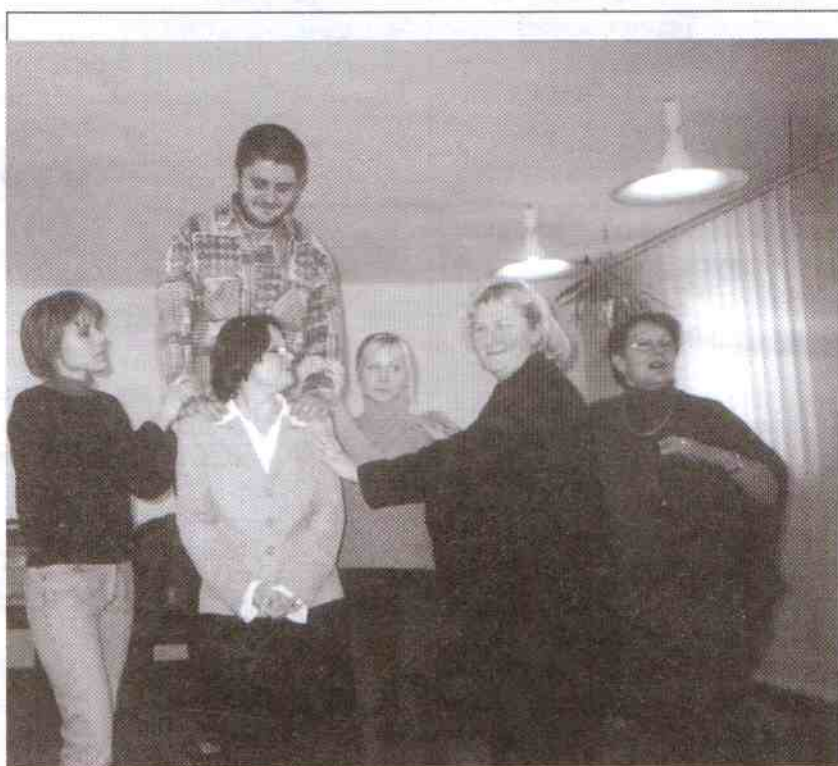
Jedna ze scen dramowych ogywana przez uczestników szkolenia

Szczególnie warto podkreślić zaangażowanie pań z Łącka, które prowadzą zajęcia z dziećmi w świetlicy przy miejscowej parafii.