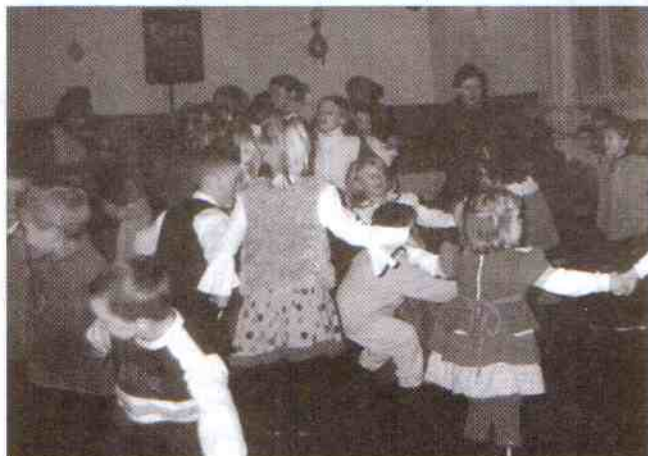
Dzieci popisywały się swoją wiedzą ze znajomości bohaterów bajek