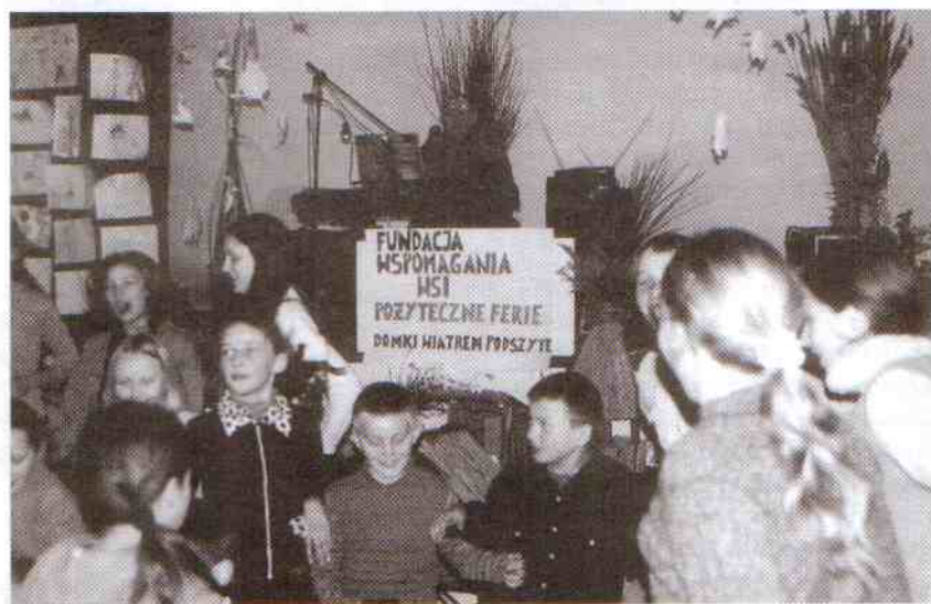
Wspólna zabawa na zakończenie ferii