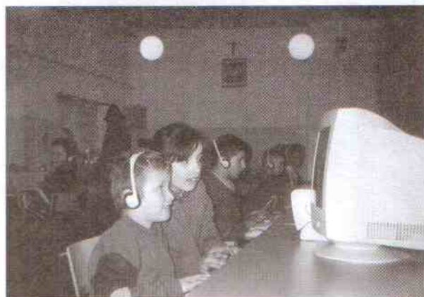
Beztroski czas ferii.

Dzięki finansowemu wsparciu Gminnej Komisji Rozwiązywania Problemów Alkoholowych w Postominie doszły do skutku zajęcia w okresie ferii w świetlicy szkolnej przy SP w Korlinie. największym powodzeniem cieszyło się czatowanie w sieci internetowej. Były też zawody sportowe, wyjazd do kina w Słupsku, turnieje gier planszowych i dla chętnych... korepetycje z matematyki. Dla wszystkich uczestników był przygotowany posiłek wraz z gorącą herbatą.