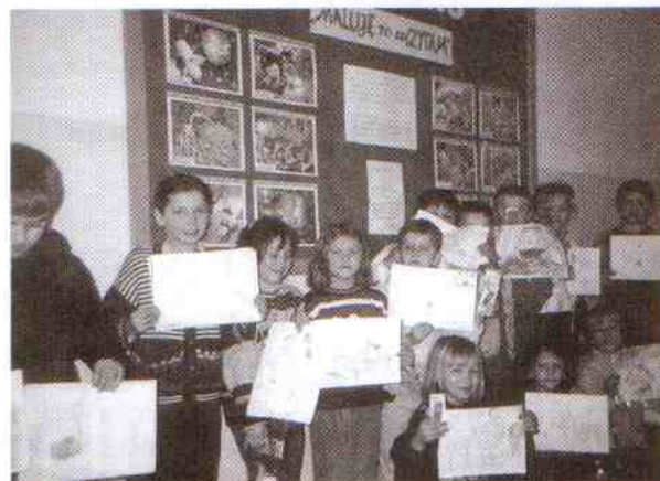
Powyżej lekturo-malarze z klasy I i II.