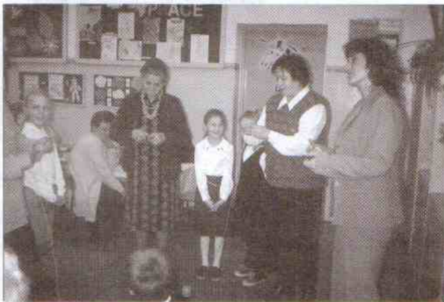
Uczniowie i wychowawczynie klasy II

Ten dzień będziemy długo pamiętali - orzekli wszyscy zgodnie. Szkoda, że Dzień Babci i Dziadka jest tylko raz w roku!