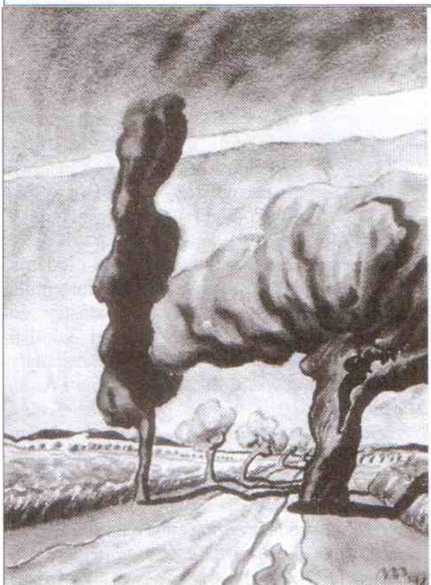
Günter Machemehl, Droga do Łącka, akwarela, 1941