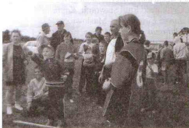
Konkurencja rzutu lotką cieszyła się dużym powodzeniem