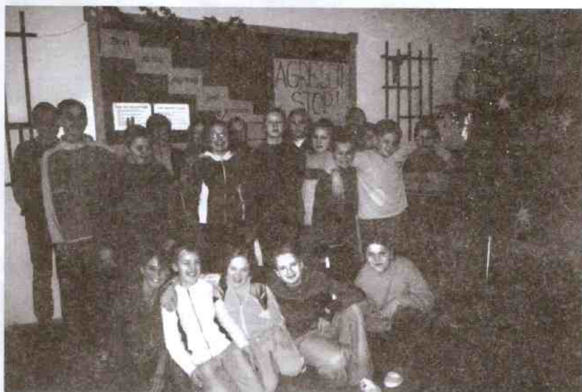
Uczniowie klasy szóstej w trakcie apelu

Wprawdzie zawiodła trochę technika (kłopoty z nagłośnieniem), ale uczestnicy happeningu bardzo starali się przekazać wszystkim ludziom słowa pełne miłości i dobroci. Działanie to było jednym z elementów szkolnego programu profilaktycznego.