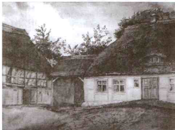
Zagroda w Rusinowie