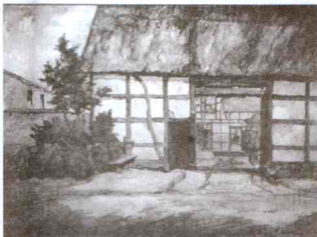
Zagroda w Staniewicach