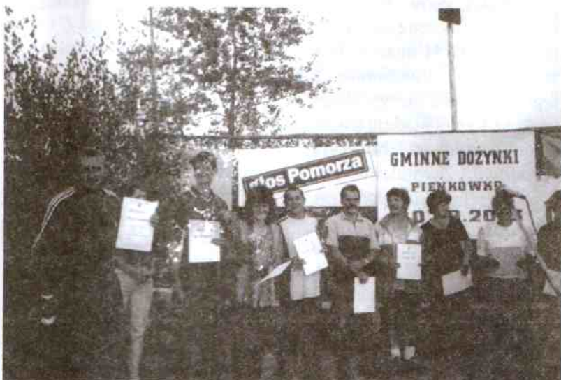
Gminne Dożynki 2003 w Pieńkowie