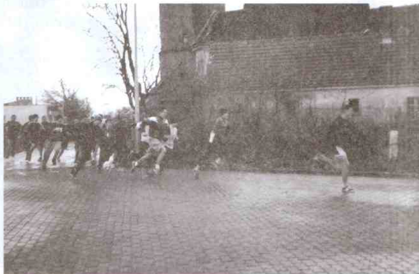
Wejście w pierwszy wiraż