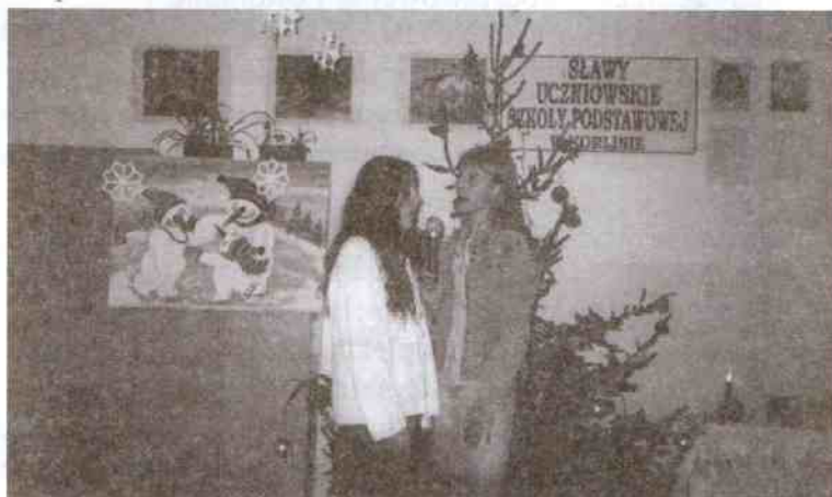
Ten duet rozpoczął poranek kolęd