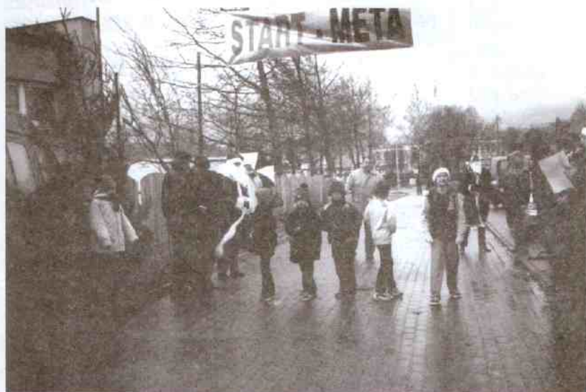
Tuż przed startem najmłodszych

6 grudnia 2003 r. w Jarosławcu, w okolicach latarni morskiej, odbył się III Bieg Mikołajkowy „Powitanie Zimy”. Obok biegu głównego odbyły się