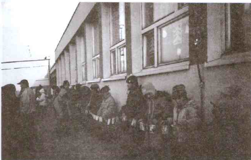
Dzieci swym łańcuchem kartek świątecznych oplóły całą szkołę