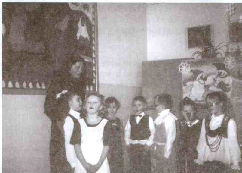
Przedszkolaków o życiu rozważania