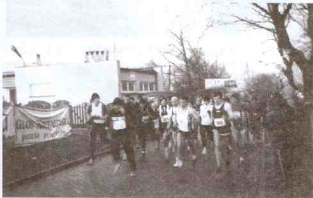
Ruszyli uczestnicy biegu głównego