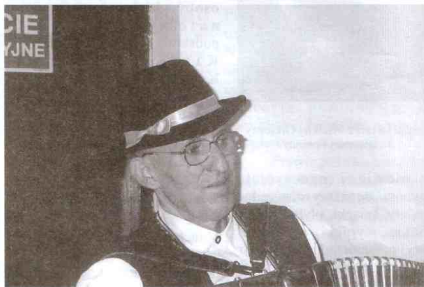
Najlepszy gawędziarz zachodniopomorskiego (laureat trzech kolejnych konkursów) również jest znakomity w śpiewaniu i grze na akordeonie (prywatnym zresztą)

Kapela obchodzi 20-lecie swego powstania i koncertowania. W ciągu tych 20 lat dawała koncerty tu i ówdzie. Promowała gminę i jej mieszkańców, a dwóch instrumentalistów ciągle pogrywa na prywatnych instrumentach (jeden