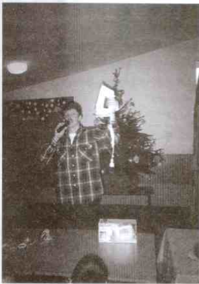
Aukcja na rzecz Wielkiej Orkiestry Świątecznej Pomocy

Oczywiście, podobnie jak w innych szkołach, odbywają się u nas okolicznościowe akademie, spotkania opłatkowe, gościmy mamy, babcię, dziadków z okazji ich świąt. Tradycyjnie już po raz piąty odbyła się w naszej szkole aukcja na rzecz Wielkiej Orkiestry Świątecznej Pomocy.