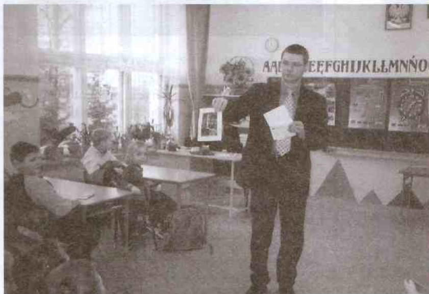
Spotkanie z przedstawicielami Zakładu Energetycznego w Słupsku

Pokazując przykłady współpracy z różnymi instytucjami zewnętrznymi, nie chcemy wyrobić przekonania, że nauczyciele naszej szkoły zdejmują z siebie obowiązek wychowania. Wręcz przeciwnie. Na każdym kroku i przy każdej okazji wskazują młodzieży wzorce zachowań w różnych sytuacjach i podejmują działania, aby wyrobić w nich patriotyczną postawę, szacunek dla tradycji i drugiego