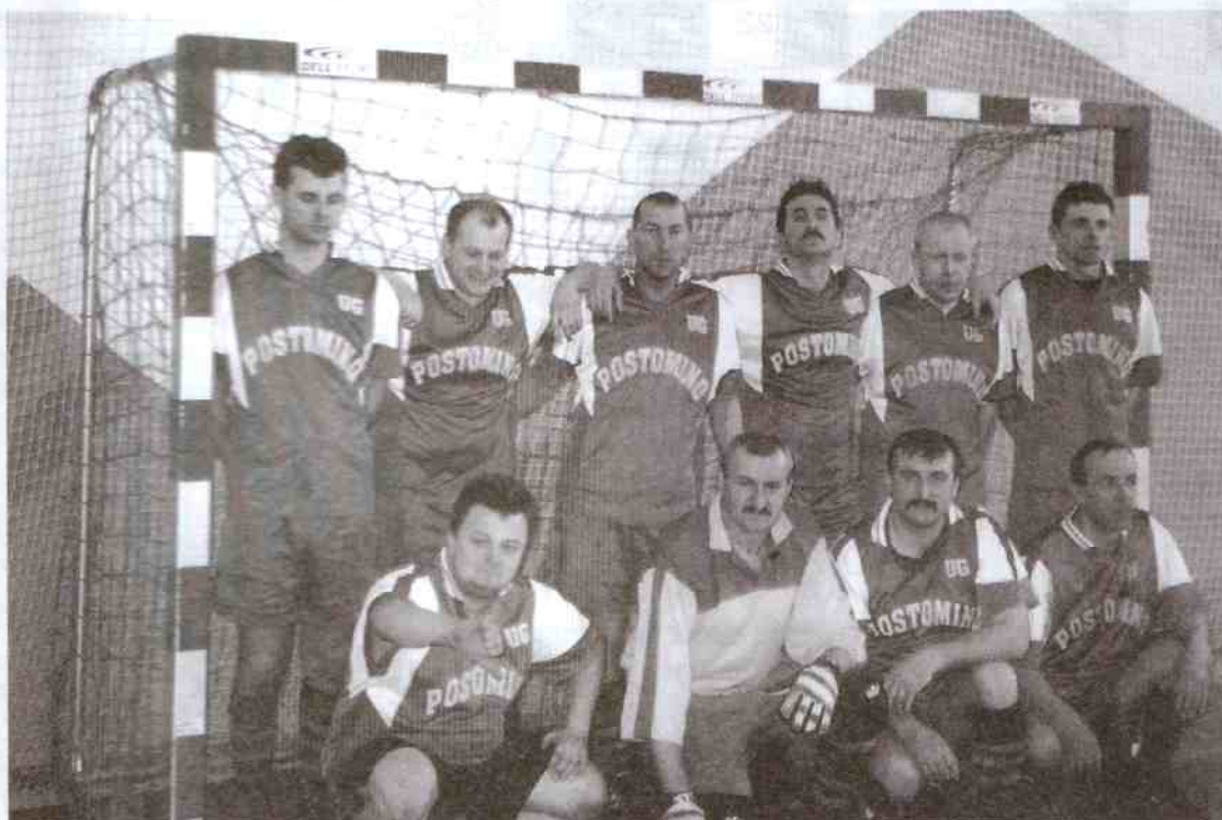
Nasi piłkarze zapowiadają, że za rok tegoroczna tabela będzie odwrócona