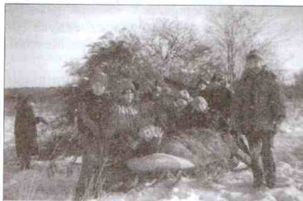
Miejsce dokarmiania w podkorlińskim lesie.

Trudno orzec, jaką pogodę mieć będziemy, kiedy do rąk Czytelników dotrze ten numer „Szeptu”, ale nie ulega wątpliwości, że tęgie mrozy i duży śnieg dokuczyły nam pod koniec stycznia. W tym czasie harcerze z Korlina regularnie dokarmiali leśne zwierzęta zwożąc siano, zboże, brukiew i inne zwierzęce wiktuały.