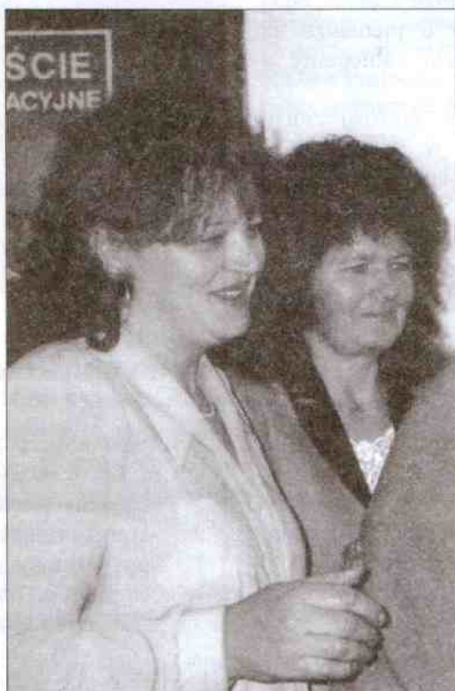
Przedstawicielki naszej pięknej części społeczeństwa