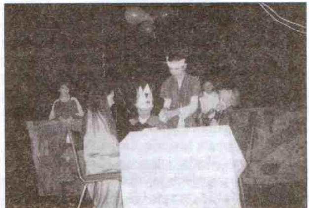
Jedna ze scen grana przez klasę piątą.

Co roku o tej porze na łamach naszego miesięcznika przedstawiamy relacje z występów teatrzyków klasowych, które są wystawiane w ramach Przeglądu Kulturalnego w sali w Łącku.