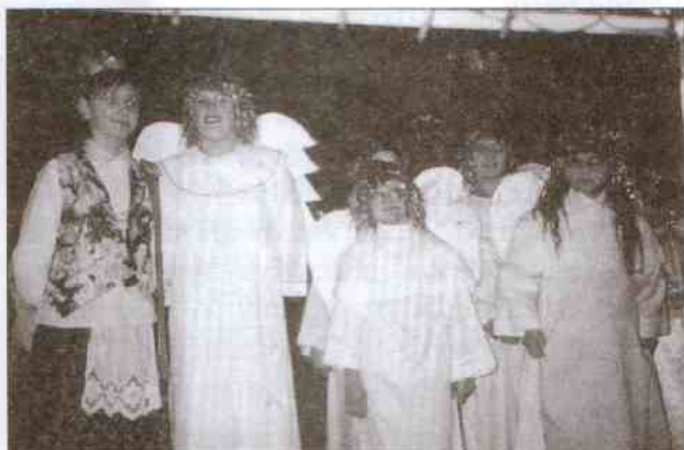
Jasełkowe aniołki z Kopnicy

Do pięknie, okolicznościowo, udekorowanej sali Domu Strażaka tłumnie przybyli mieszkańcy Karsina, Wszędzienia, Kanina, Dzierżęcina, Masłowic i sąsiadujących Sulimic (gmina Darłowo) całymi rodzinami. Okazją była zabawa choinkowa - Karsino 2004.