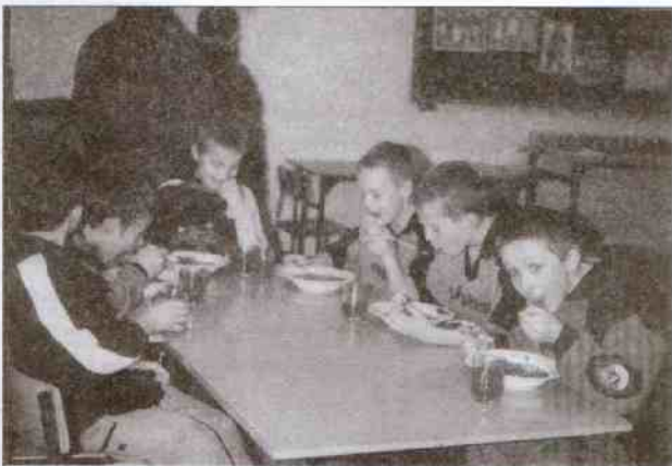
Posiłek regeneracyjny w czasie przerwy

Wśród chłopców, po zaciętych walkach, najlepsza