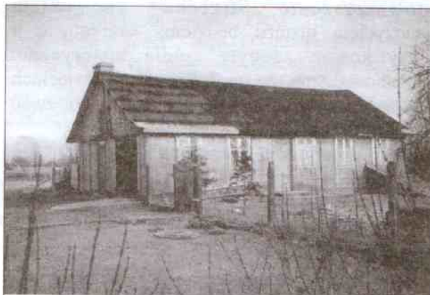
Miejsce gromadzenia przyszłych zbiorów?

Pytanie: Jaki jest sens nadawanie tak dużego znaczenia takiemu małemu regionowi w dobie wszechogarniającej nas globalizacji?