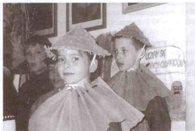
Wtórują im zielone drzewa

Po wspólnym widowisku (recytacje, piosenki) każda z klas prezentowała się w konkursie ekologicznym - plakat, odpowiedzi na poważne pytania (co to jest ekologia, a co to recykling, co to segregacja odpadów, co zanieczyszcza najbardziej nasze środowisko i jak temu przeciwdziałać) oraz piosenka (klasy II b i III a wykonały piosenki do własnych tekstów). Wszystkie klasy spisały się