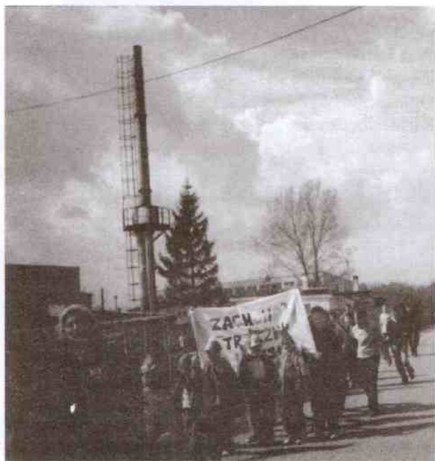
Przemarsz przez wieś

Działania sportowe są doskonałą alternatywą dla używek. Umiejętność pogodzenia się z porażką, uszanowanie przeciwników, poradzenie sobie z wygraną - to edukacyjne i profilaktyczne cele tej kampanii.