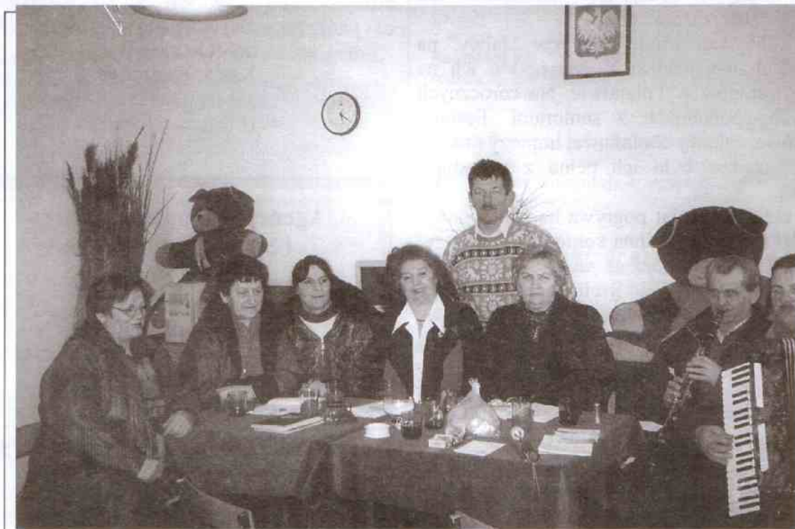
Przerwa w trakcie jednej z prób kwietniowych

Pieńkowanie grają i śpiewają przy ogniskach, na piknikach, spotkaniach towarzyskich i integracyjnych. Kiedyś w zakolu Wieprzy pod Mazowem odbywały się spotkania miesz-