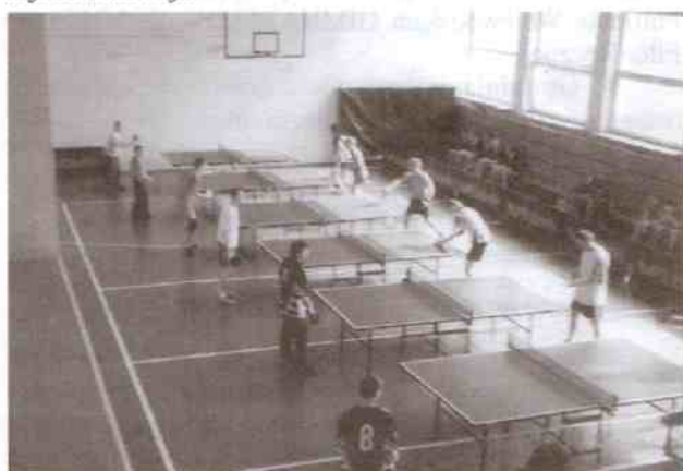
Ogólny widok tenisowych pojedynków

Tylko rok cieszyło się Królowo tytułem mistrza gminy w tej konkurencji.