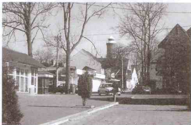
Jarosławiec w wiosennej szacie