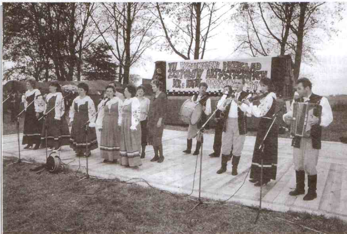
Zespół w składzie z 1991 roku (archiwum)

kulturalne wsi Pomorza Środkowego. Grywali i śpiewali w Bytowie, Kołobrzegu, Złotowie, w Drawsku Pomorskim, Postominie, Jarosławcu, Pieńkówku, Czarnem,