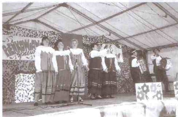
Jubileuszowy występ kapeli - jubilatki

wymienionych, popisywały się zespoły szkolne z Jarosławca, Korlina, Pieszca i Staniewic. Był to