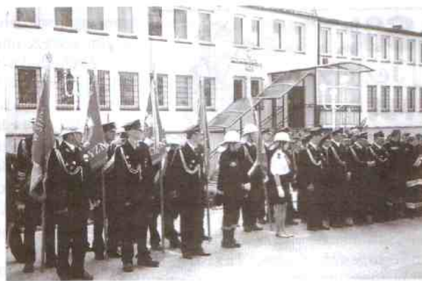
Strażackie oddziały ze sztandarami tuż przed rozpoczęciem parady.

wymienionych, popisywały się zespoły szkolne z Jarosławca, Korlina, Pieszca i Staniewic. Był to