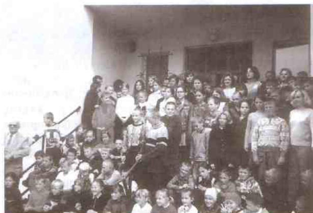
Międzynarodowe towarzystwo na schodach korlińskiej szkoły.