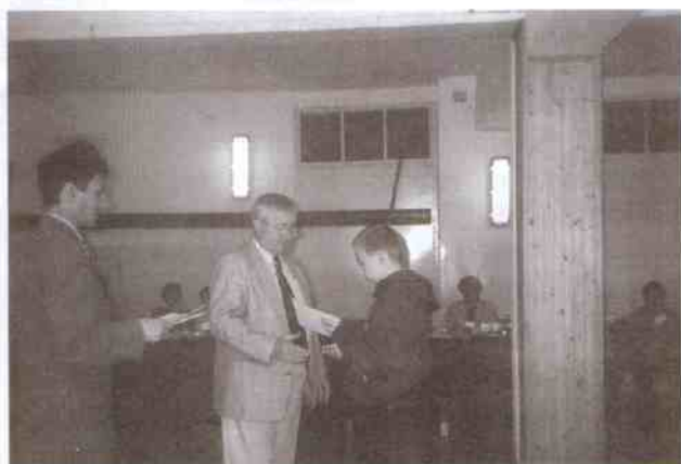
Moment wręczenia wyróżnień kapitanowi drużyny z Korlina.

Naszą gminę w tegorocznym konkursie myśliwskim, rozgrywanym po raz trzeci w Charnowie, reprezentowała drużyna ze szkoły w Korlinie. Oprócz rozległego myśliwskiego nazewnictwa uczestnicy musieli w specjalnie przygotowanym teście wykazać się wiedzą z zakresu ochrony gatunkowej zwierząt, przepisami regulującymi działalność parków narodowych. Najprzyjemniejszą częścią testu było wskazywanie tropów zwierząt, przyporządkowywanie zwierząt do swoich siedlisk, a także określanie zachowań zwierzyny łownej w różnych okresach swojego życia. Ciekawa formuła turnieju, a także bogata oprawa, zostawiła na jego uczestnikach niezatarte wrażenie. A co do występu korlinian, to wrócili z tarczą, zajmując wśród 6 drużyn z gminy i miasta Ustki II miejsce.