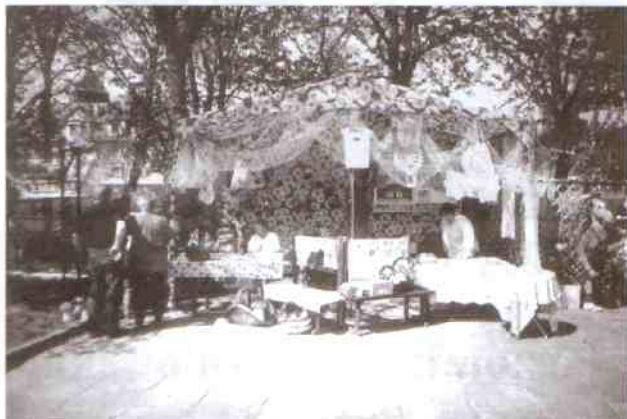
Stoisko „Strzechy” w sławińskim amfiteatrze

Nadmorskie Stowarzyszenie Agroturystyczne „Strzecha” w Łącku zostało wyróżnione przez Starostę Sławińskiego za udzieloną pomoc i okazane wsparcie podczas realizacji programu Partnerstwo Miast, Gmin i Powiatów.