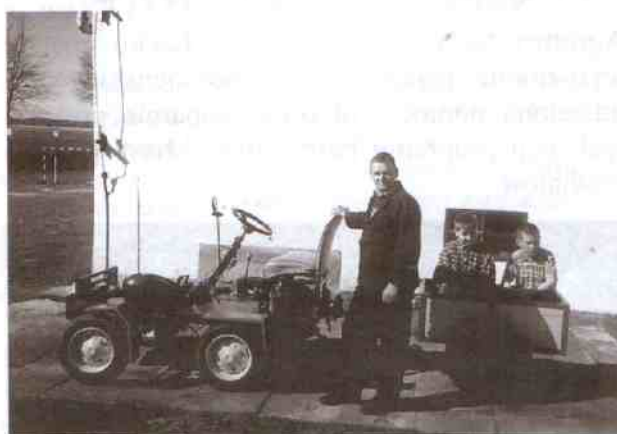
Pojazd wraz ze swoim konstruktorem

chwila jest wielką, nieskrywaną atrakcją dla dzieci.