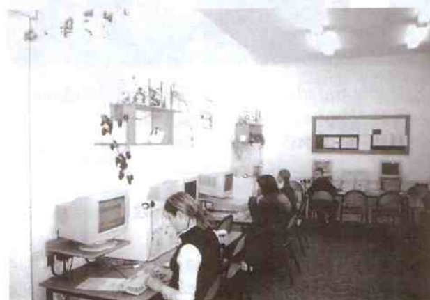
Fragment konkursu w pracowni informatycznej