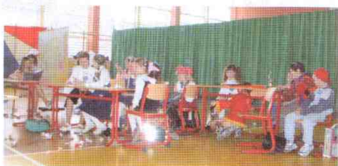
Ananasy z korlińskiej klasy