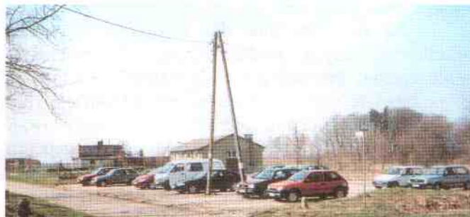
Parking przykościelny w Pałowie