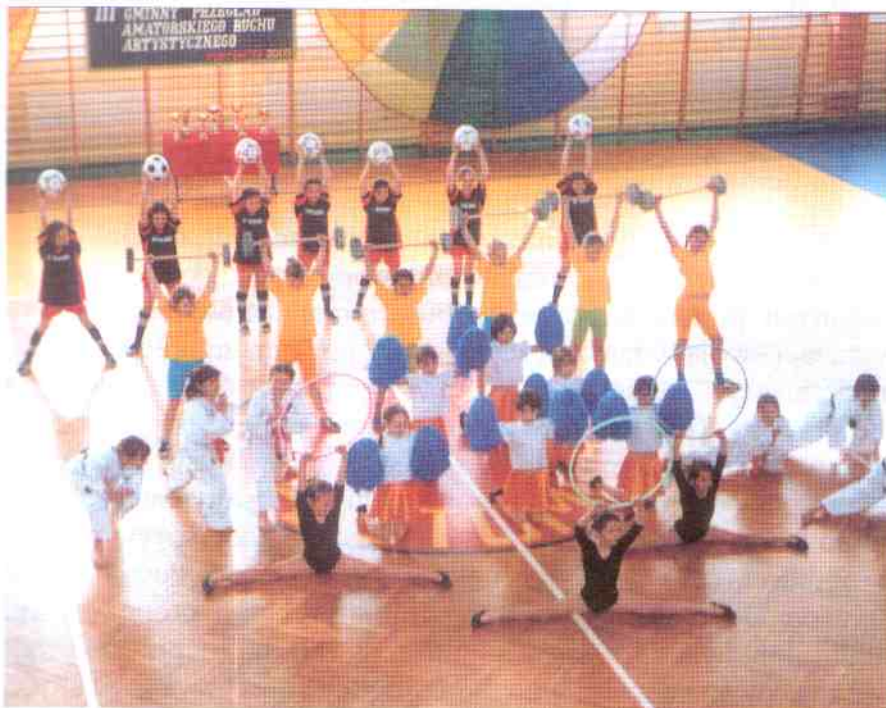
Sport nas łączy

Kolejny III Gminny Przegląd Amatorskiego Ruchu Artystycznego Postomino 2005 pokazał, jak uzdolnioną mamy młodzież i jak bardzo potrzebne jest miejsce, w którym mogłaby się ona pokazać.