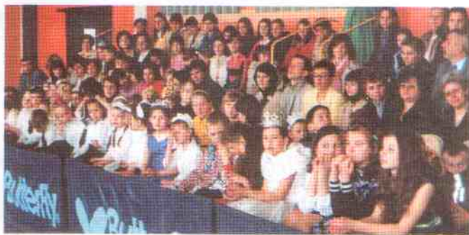
Widownia. Na pierwszym planie mali artyści z Jarosławca

informować, o ewentualnych porażkach zmilczymy, ale póki co, warto inwestować w nasze dzieci i młodzież, bo potrafią pięknie pokazać i przeżywać sztukę przez duże „S”.