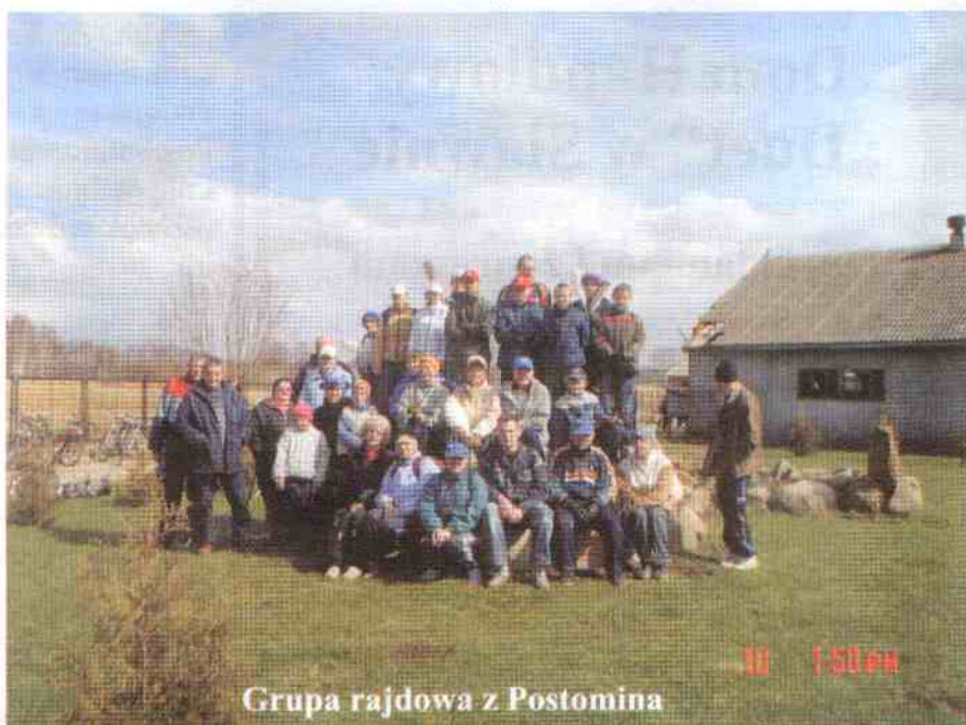
Grupa rajdowa z Postomina

Następnie 160 kół rowerowych lub jak kto woli 80 cyklistów, ruszyło w kierunku Mazowa i Chudaczewka zobaczyć jak na fermie strusie witają wiosnę. Czekal tam właściciel Tadeusz