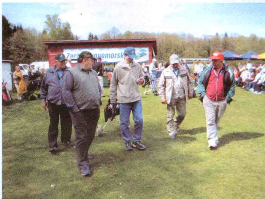
Zwycięska ekipa wyrusza z trenerem na bój.

Właściwe ustawienie nóg, przymiarka, zamach kijem najpierw