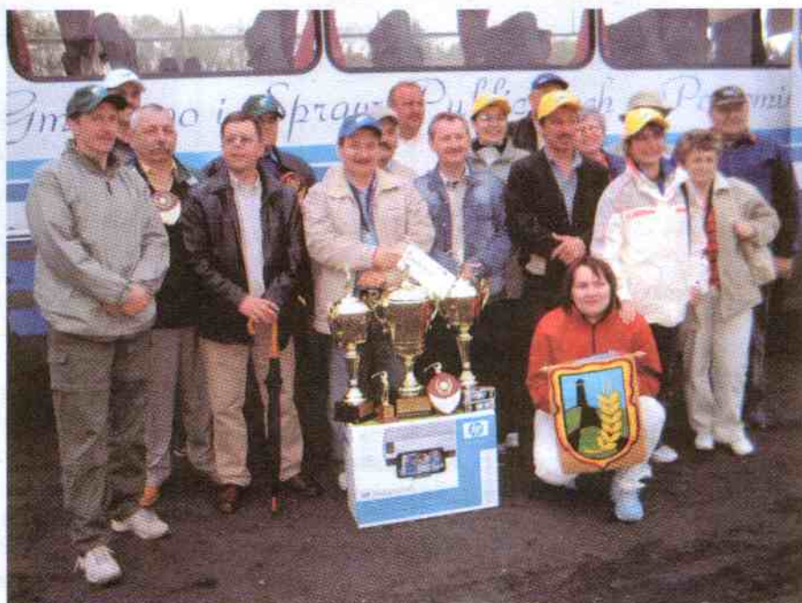
Przyjechaliśmy, zobaczyliśmy, wygramy