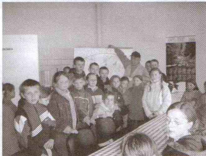
Dzieci z Postomina wręczyły na spotkaniu plakat.

- Okazuje się, że do kosza z napisem „plastik” możemy wrzucić karton po mleku, czy soku - dziwią się dzieci. Można też wrzucić puszki po konserwach czy opakowania po chemii gospodarczej. To wszystko trafia do segregacji, wszystko jest wykorzystywane.