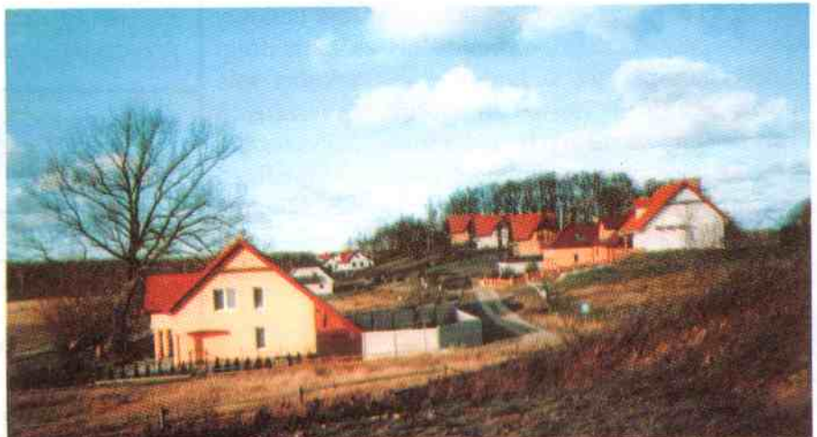
Osiedle w Rusinowie