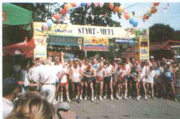
Tuż przed startem

temperaturze powietrza, trzymając się w niewielkich odległościach. Od jedenastego kilometra ton walce zaczęło