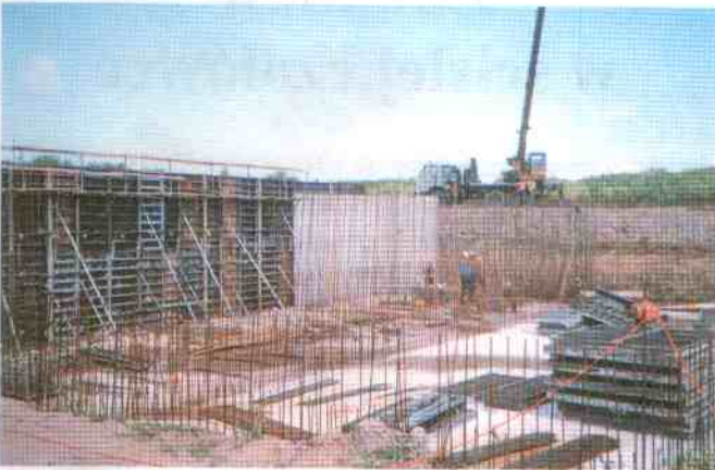
Budowa oczyszczalni w Jarosławcu

Otrzymaliśmy 650 tys. zł od Marszałka Województwa na budowę stadionu sportowego w