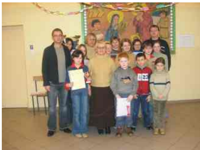
Najprawdziwsi laureaci, organizatorzy i opiekunowie.

A co do w tpliwo ci, czy zdarzenia z opowie ci o zaj czku Bend aminie i złotym Mikołaju rzeczywi cie miały miejsce, to tylko zrz dz cy racjonalni ramole mogliby zakwestionowa dzieci ce bogactwo wynurze .