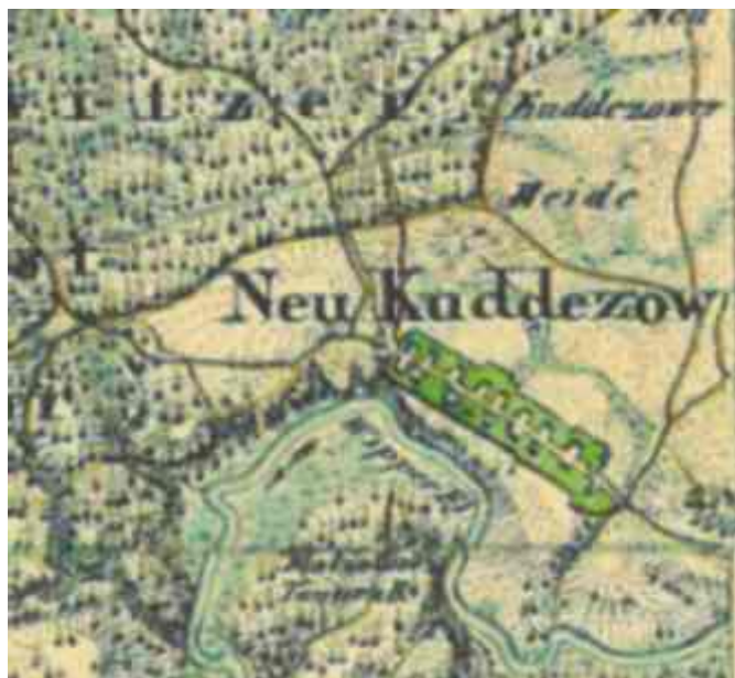
Fragment mapy z 1836 roku z wioskami Chudaczewo i Chudaczewko (Neu Kuddezow).