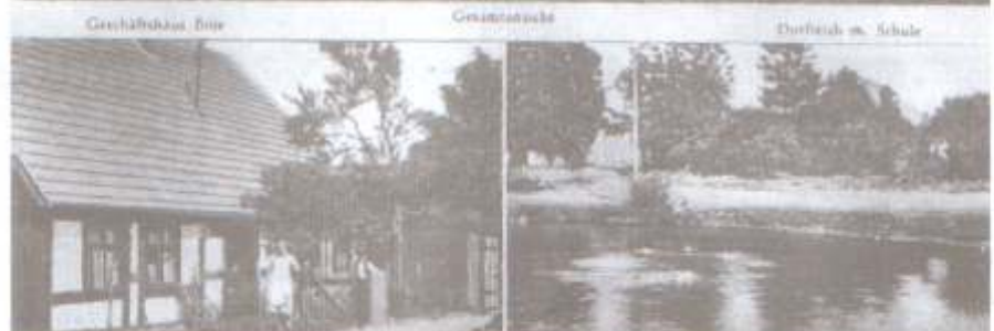
Pocztówka z okresu międzywojennego przedstawiająca widok ogólny na wieś (u góry), sklep (z lewej), staw wiejski i szkołę (z prawej)