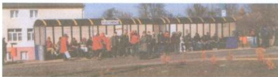
Postomiński przystanek autobusowy.

ile w tzw. sukcesach może być jego osobistego udziału, ile Rady Sołectkiej, a ile samorządu gminnego, gminnej władzy wykonawczej, podmiotów