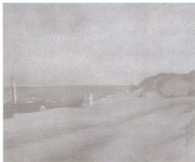
Brzeg morski, 1927, pastel 41x51 cm

lato spędzał w tej miejscowości ekspresjonista Karl Schmidt Rottluff).