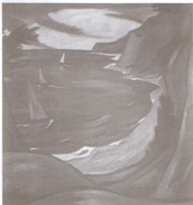
Jershöft, 1921 olej na płótnie, 93x92 cm Augustinermuseum Freiburg