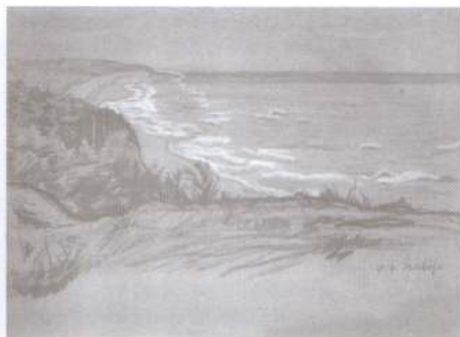
Künstenlandschaft (Nadbrzeżny pejzaż), kolorowa kredka, 21,5x29,7 cm

Podczas pobytu w Sławnie powstaje wiele prac, których tematem są widoki powiatu. R. Muchow utrwalił m. in. dwory powiatu sławieńskiego (cykl litografii kredkowych wydanych w 1924 roku) namalował też liczne pejzaże przedstawiające Sławno i okolice. Z jarosławieckich prac Muchowa przedstawiamy trzy pejzaże przedstawiające nadmorski brzeg.