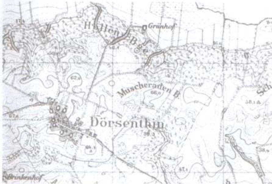
Mapa topograficzna z Dzierzęcinem z 1934 roku skala 1:25.000

Liczba ludności: w 1950 - 71, w 1960 - 70, w 1970 - 76, 1980 - 75, w 1990 74 i w 2004 - 70. Liczba gospodarstw rolnych obecnie wynosi 19. Sołtysiem wsi jest Teresa Preś. W wiosce działa Koło Gospodyń Wiejskich i świetlica. Znajduje się tu także licząca ponad pół wieku kapliczka. (jes)