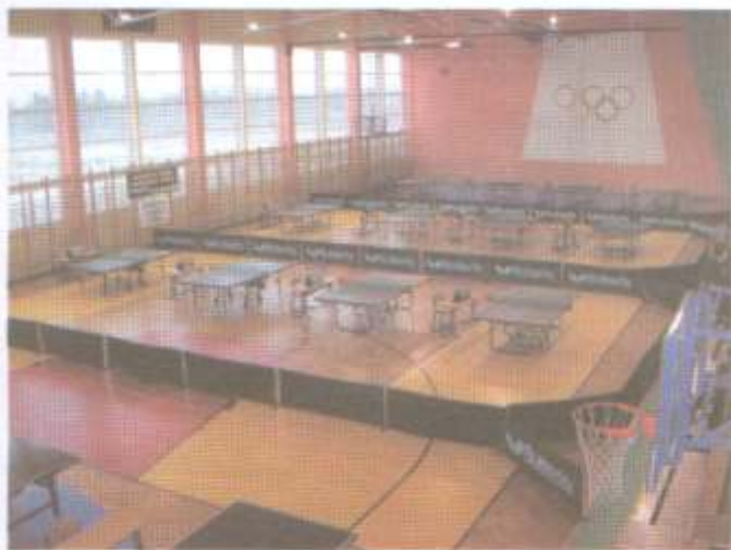
Wszystko gotowe - można zaczynać