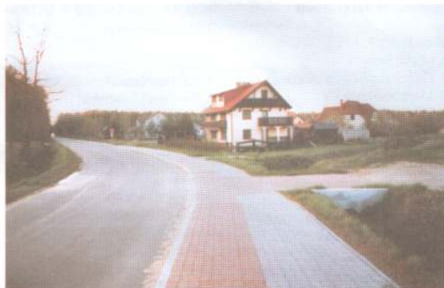
Nowe osiedle i droga w kierunku Jarosławca

poprawa nawierzchni ponad kilometrowej drogi w kierunku morza o nawierzchni żuźlowej, często przez wczasowiczów używanej. Wydarzeniem ostatnich lat była budowa nowej nawierzchni drogi w kierunku Jarosławca do tzw. pasa startowego wraz z