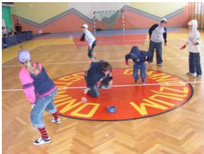
Zespół break dance ze Staniewic.