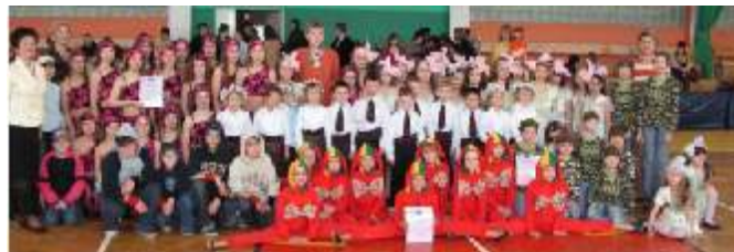
Zespoły taneczne naszej gminy.