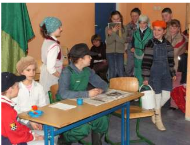
Stary humor w nowym, dobrym wykonaniu „Kabaretonu” z Korlina.