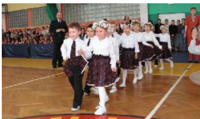
Poloneza czas zacząć - zespół z Jarosławca.