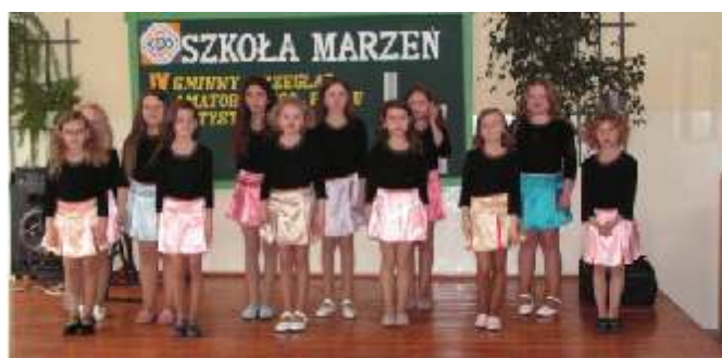
Zespół wokalny „Bursztyнки” z Jarosławca.