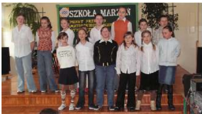
Zespół wokalny ze Staniewic.