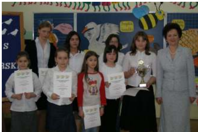
Finalistki konkursu recytatorskiego.