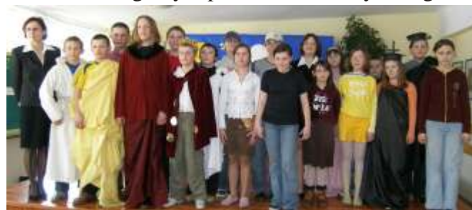
Mikołaj Kopernik w klasie VI a.