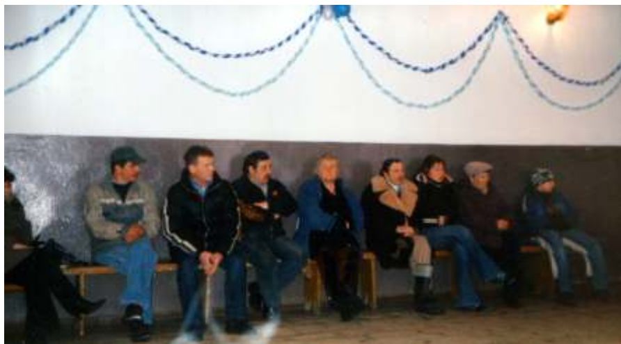
Na zebraniu w Wilkowicach

Skoro konserwator zabytków stwarza trudności w sprawie budowy domu pogrzebowego w Łęku, to oszukajmy go i zbudujmy ten przybytek na naszym cmentarzu (Chudaczewo).