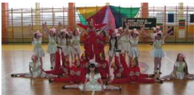
Popis gracji i akrobacji - „Dyg II” Postomino.