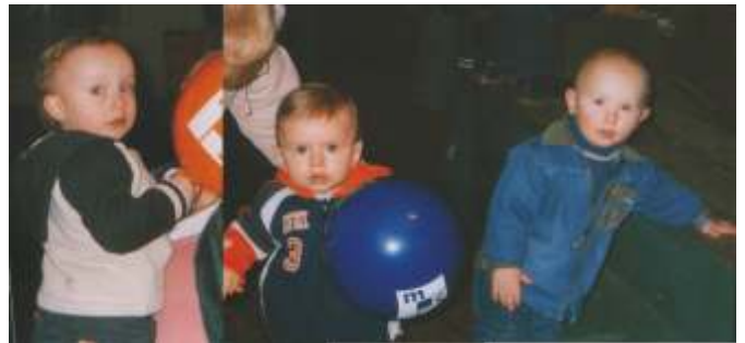
Najmłodszy uczestnicy mikołajkowego szale stwa