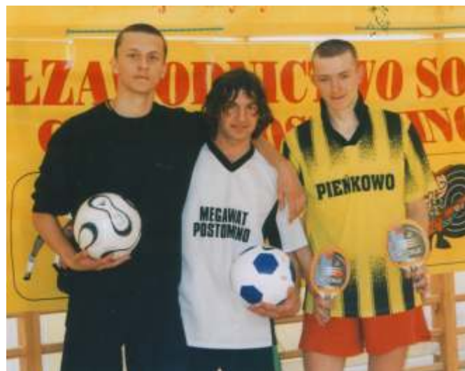
Najlepsi w onglowaniu piłki ze zdobytymi nagrodami