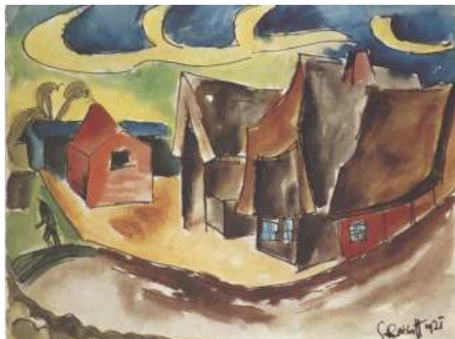
Karl Schmidt-Rottluff: Jarosławiec, 1921, akwarela, 48,2 x 61,2 cm

Zachowała się większość zabudowy istniejącej przed ostatnią wojną. Najbardziej charakterystyczne są XIX-wieczne budynki mieszkalne szerokofrontowe, parterowe, o konstrukcji ryglowej. Najciekawsze to domy nr 3, 8, 21, 31, 32, 36, 43.