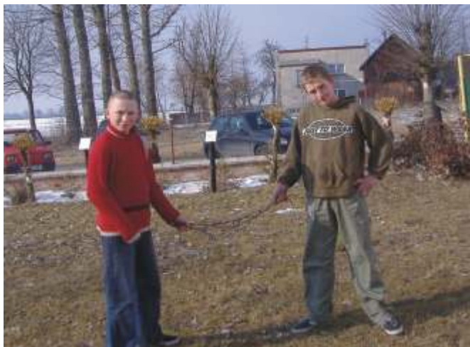
Na zdjęciu: gorzki i wstydlivy plon kilkutygodniowej akcji ochrony zwierzyny płowej.