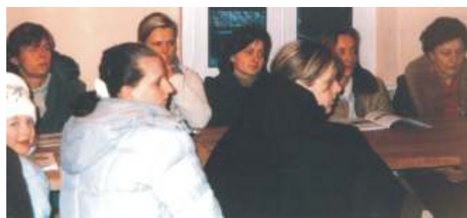
w Dzier cinie

powiatowych), utylizacji eternitu, poprawie o wietlenia ulicznego, likwidacji bruków w niektórych wsiach, budowie placów gier i