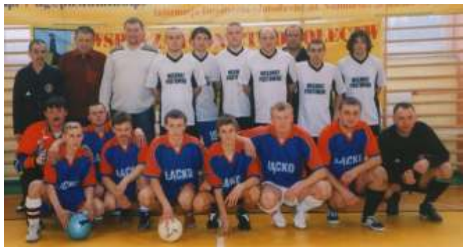
Drużyna Postomina i Ł cka przed wielkim finałem

IX turniej o puchar wójta gminy zgromadził 15 zespołów sołeckich. W wielkim finale Postomino pokonało Ł cko 4:2, a w małym (walce o trzecie miejsce) Marszewo okazało się lepsze od Pie kowa w stosunku 4:1. W rozegranych