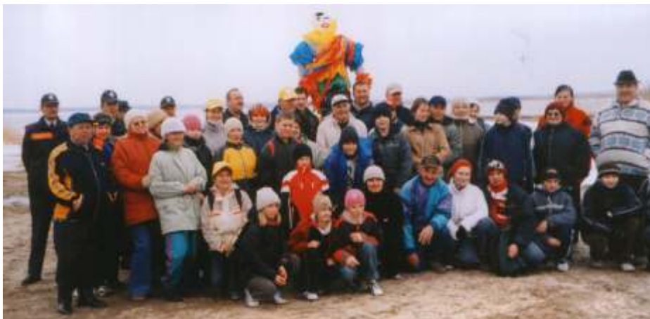
„Rodzinne” zdjęcie uczestników festynu