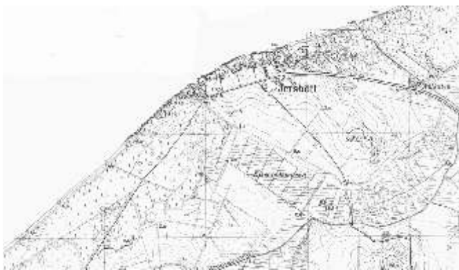
Mapa topograficzna Jarosławca z 1937 roku (skala 1:25.000).

Na początku XIX wieku w związku z licznymi katastrofami