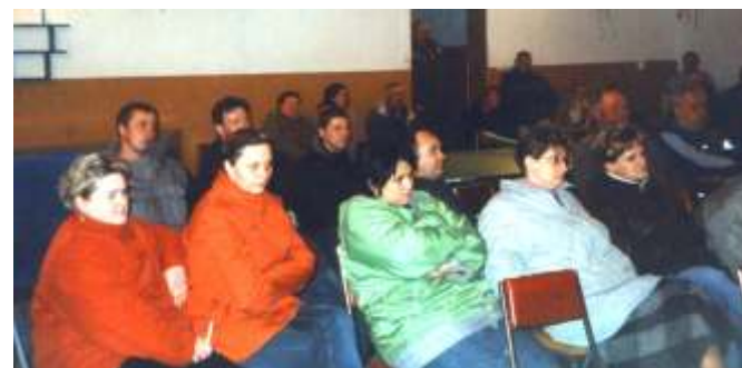
w Ł cku