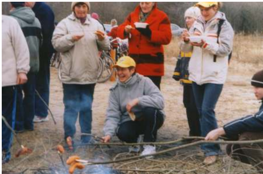
Grochówka i kiełbaski smakowały wszystkim