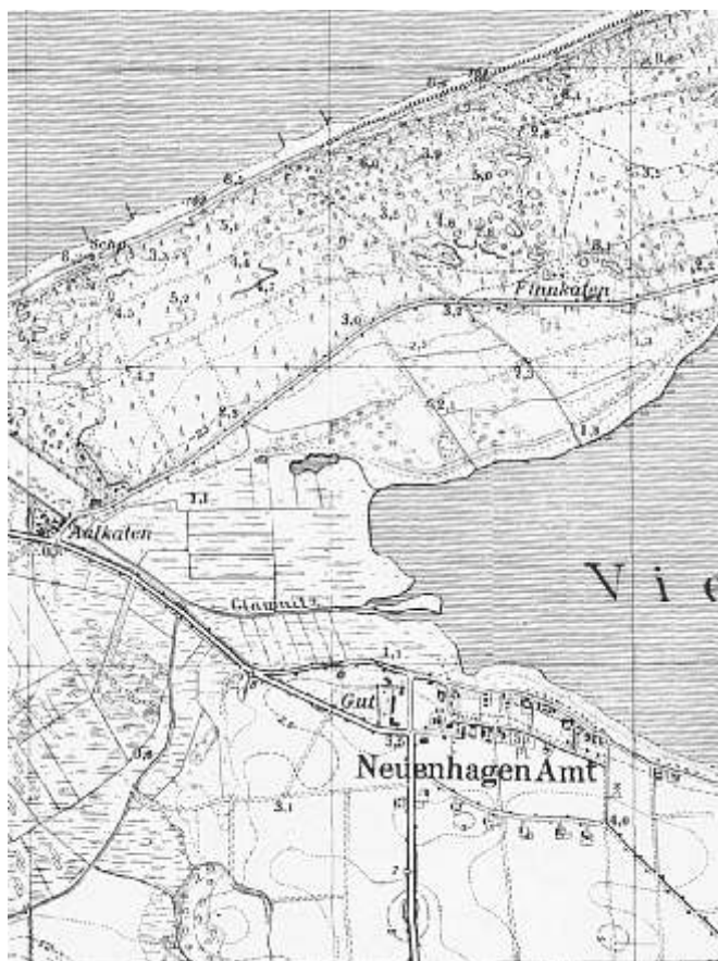
Mapa topograficzna Jezierzan z roku 1937.

Ewangelicka ludność Jezierzan należała do parafii w Łęce.