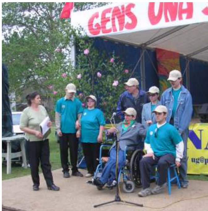
Piosenkarski popis grupy postominskiej

Tego spotkania nie da si opisa . Festyn Integracyjny, jakiego jeszcze nie było GENS UNA SUMUS. Ludzie sprawni inaczej nie tylko wysłuchali prezentacji swoich szkolnych kolegów, ale zaprezentowali własne, oryginalne, na miar swoich możliwości, swego stanu ciała i ducha.