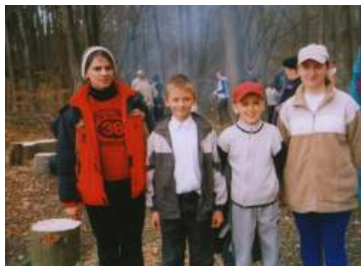
Zwyci zcy konkursu stania na jednej nodze