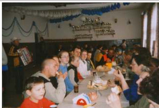
Wszyscy zajadali si przepysznym ciastem