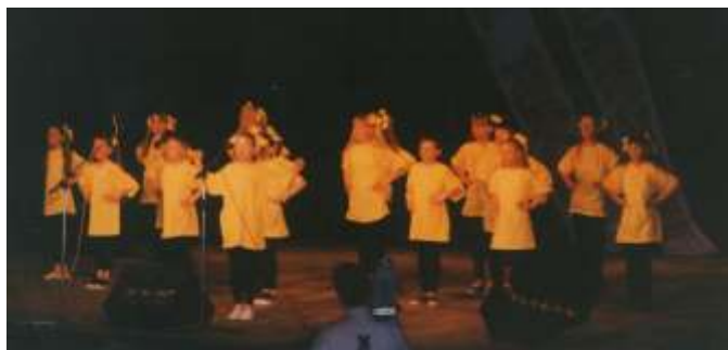
Bursztynek w czasie debiutu (1996 r.)

Jeszcze w latach 80 w jarosławieckiej szkole zaczęły się rodzić różne formy aktywności muzycznej - chór, zespół wokalny (zuchowy), instrumentalny. W roku szkolnym 1994/95 pojawiła się forma piosenki i ruchu, rok później zaczyna pracę 16-osobowy zespół (grupa mieszana), dzieciaki śpiewają i tańczą. I ta grupa przyjmuje nazwę BURSZTYNEK. Pierwszy występ to prezentacja w Słupsku (kwiecień 1996 r.) podczas Wojewódzkiego Przeglądu Zespołów Tanecznych. Zespół został zauważony.