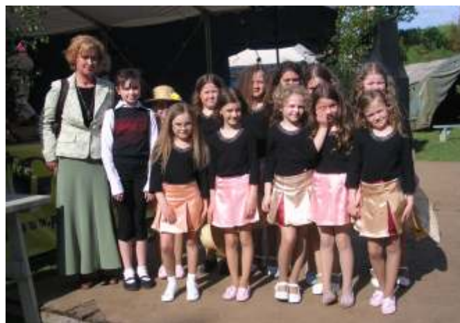
Bursztynek (najmłodsza grupa) w Ludowie Postominie - 2006

Od grudnia ub. r. pracuje sekcja instrumentalna, dziewięcioosobowy zespół flautistów, co w znacznym stopniu uatrakcyjniło prezentację. Zajęcia to nie tylko nauka piosenek, ale również wyczerpująca emisja głosu, dykcja i artykulacja.