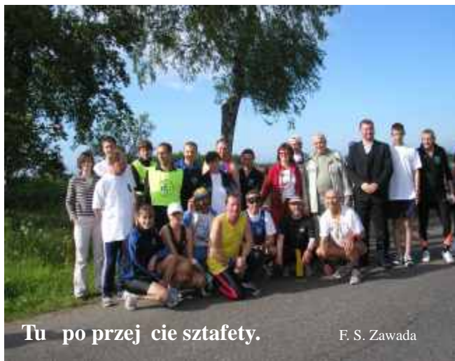
Tu po przebieg sztafety.