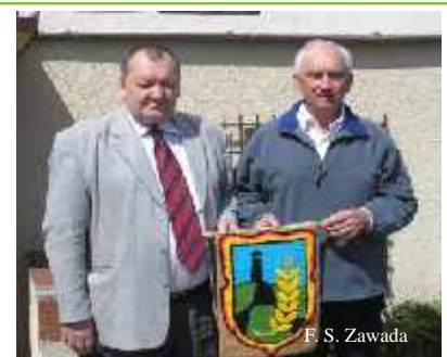
Po majowych rozmowach

Rada Gminy, Wójt Gminy Wydawca i Redakcja SZEPTU