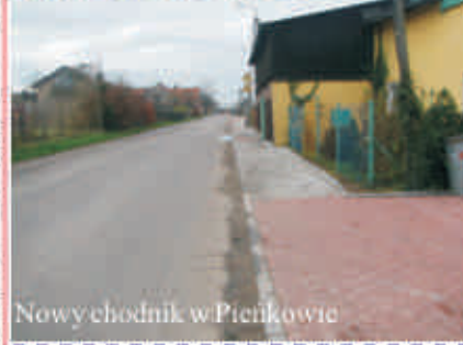
Nowychodnik w Pienkowie