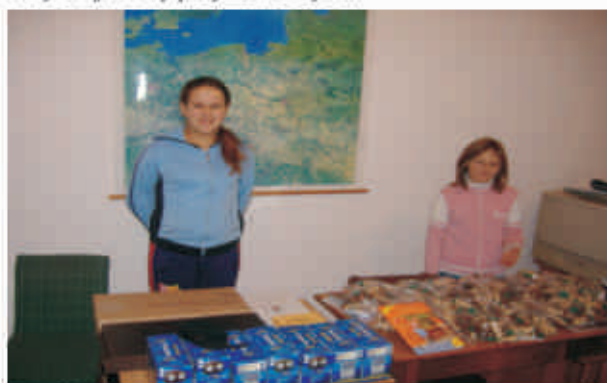
Na zdjęciu: szkolne piękności z częścią sprzętu szachowego przywiezionego w listopadzie z Warszawy. Mlecz

Jak mówi szef korlińskiej placówki „na przestrzeni ostatnich 5 lat szkoła uzyskała ze złożonych projektów blisko 40 tys. zł. Największym mecenasem okazał się Wojewódzki Fundusz Ochrony Środowiska w Szczecinie”, który z tej kwoty przyznał 20 tys. zł.