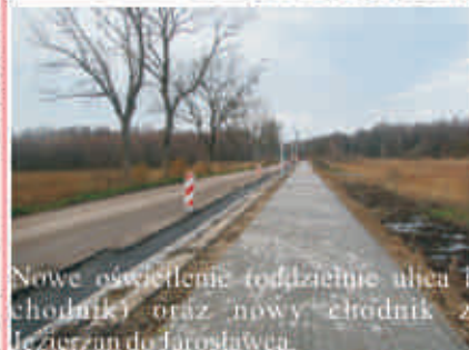
Nowe oświetlenie i chodniki oraz nowy chodnik z Jezierzan do Jarosławca