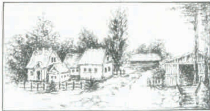
Jadwiga Czerwńska: Pustomina, widok od strony drogi 2004, rysunek tuszem.