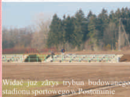
Widać już zarys trybun budowanego stadionu sportowego w Postominie