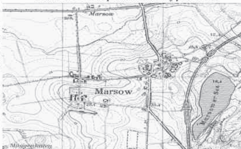
Mapa topograficzna Marszewa z 1937 roku