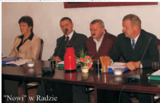
"Nowi" w Radzie