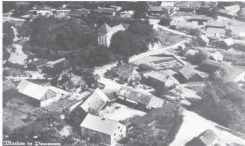
Marszewo z lotu ptaka na dawnej pocztowce