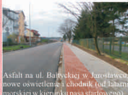
Asfalt na ul. Baltyckiej w Jarosławcu, nowe oświetlenie i chodnik (od latarni morskiej w kierunku pasa startowego)