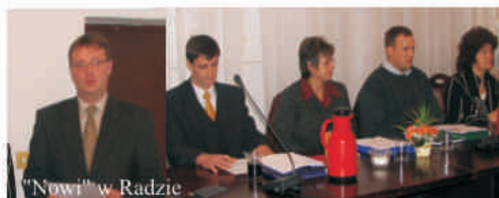
"Nowi" w Radzie

Siedmiu kandydatów na radnych uzyskało poparcie od 1 do 15 wyborców.