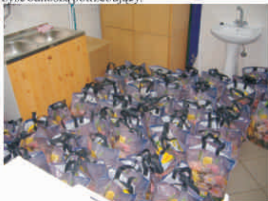
Na zdjęciu: uczniowski obiekt pożądania przed jego wydaniem w Szkole Podstawowej w Korlinie Mlecz

Wszyscy chylą czoła przed pomysłodawcami dożywiania z naszego urzędu gminy za taką formę pomocy, w której korzyść odnoszą potrzebujący.