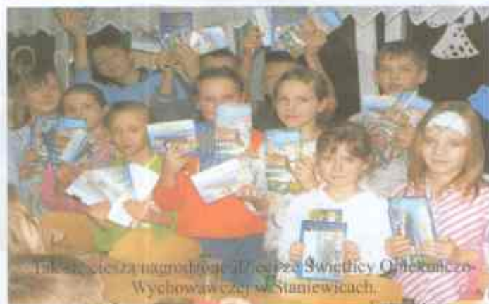
Tak się cieszą nagrodzone dzieci ze Świetlicy Opiekuńczo-Wychowawczej w Staniewicach.

Wpłynęło 17 rozwiązań (nawet piękne rysunki tykw) - wszystkie od dzieci ze świetlic opiekuńczo-wychowawczych w Staniewicach i w Pieszczu. Gratulujemy spostrzegawczości. W nagrodę wszystkie dzieci otrzymały książki.