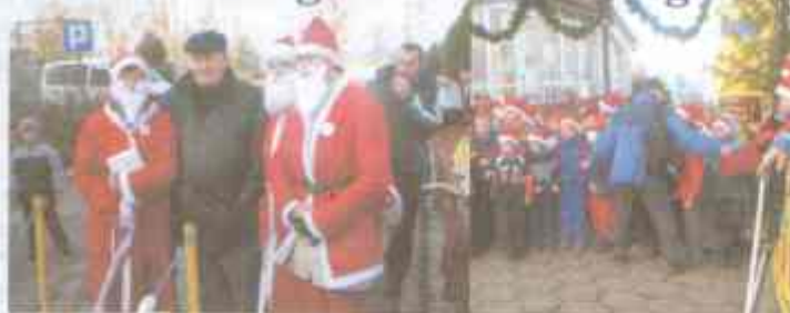
Foto z Biegu Mikołajkowego