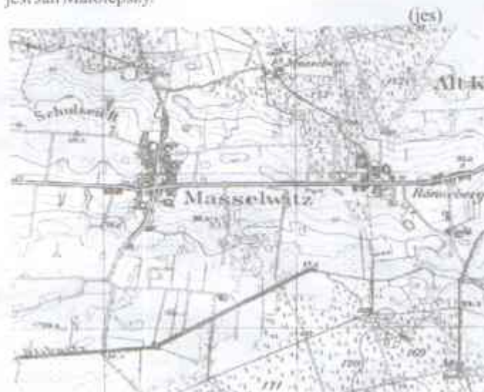
Mapa topograficzna z 1934 roku

Liczba ludności wiejskiej w 1950 roku wynosiła 157 osób, w 1960- 152, w 1970 - 161, w 1980 - 150, w 1990 - 154, w 2005- 153. Liczba gospodarstw rolnych wynosi 19. Obecnie we wsi działa Ochotnicza Straż Pożarna i funkcjonuje sklep. Sołtysem jest Jan Malolepszy.