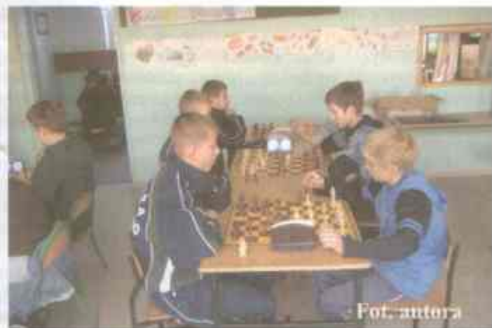
Na zdjęciu: bratobójczy pojedynek drużyn z Korlina i Postomina

III miejsce wśród gimnazjalistów zajęła drużyna z Zespołu Szkół w Kopnicy.