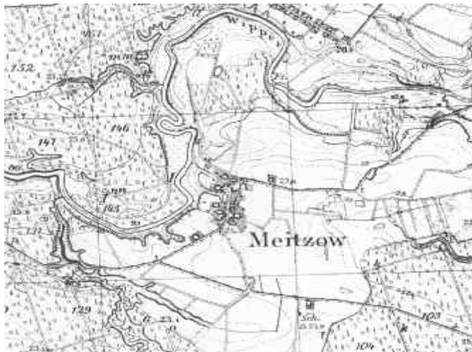
Mapa topograficzna z 1934 roku