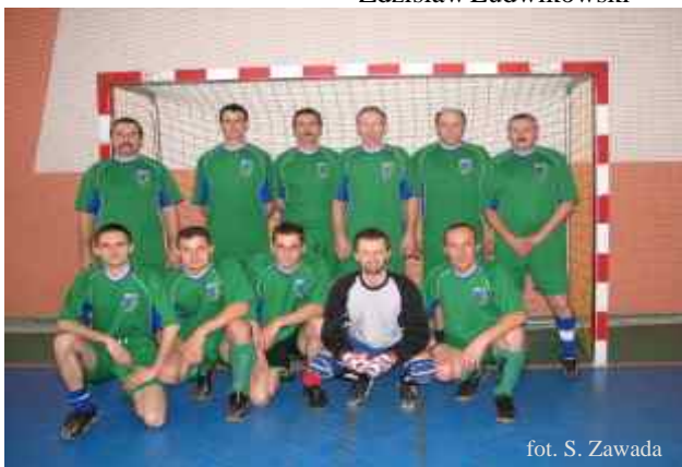
fol. S. Zawada