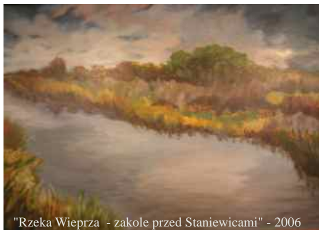
"Rzeka Wieprza - zakole przed Staniewicami" - 2006