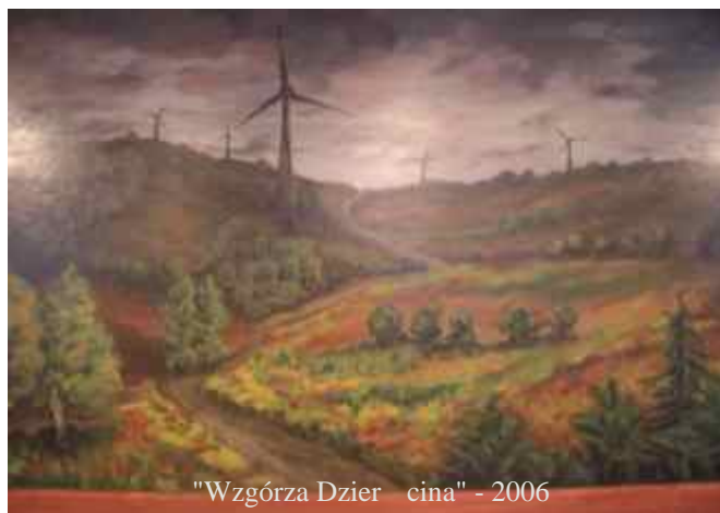
"Wzgórza Dzierżycina" - 2006