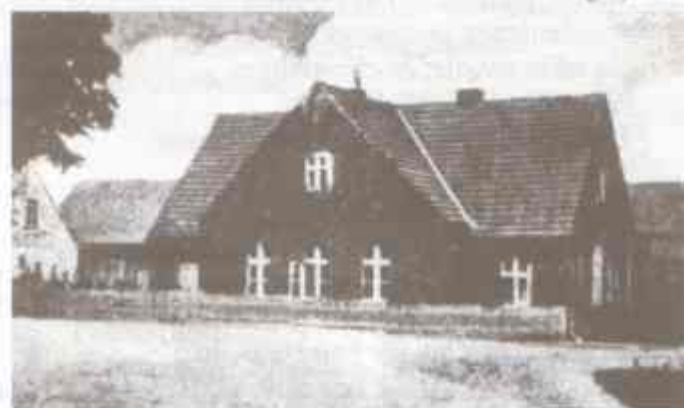
Budynek szkoły na dawnej fotografii

Sołectwo Pieszcz zaprasza na Festyn w dniu 26.05.07 godz. 15.00