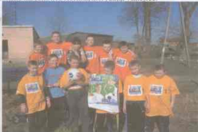
Na zdjęciu: na górze triumfatorzy rozgrywek z Królewa i v-ce mistrzowie w dolnym szeregu z Łącka.

Okazało się, że wśród miejscowości, z których chodzą dzieci do szkoły, wioską najbardziej usportowioną jest Królewo. Dalej Łącko i Łęzek. Umiejętności sportowych, a może i pełnej determinacji zabrakło narvbkowi z Korlina, który zajął 4 miejsce.