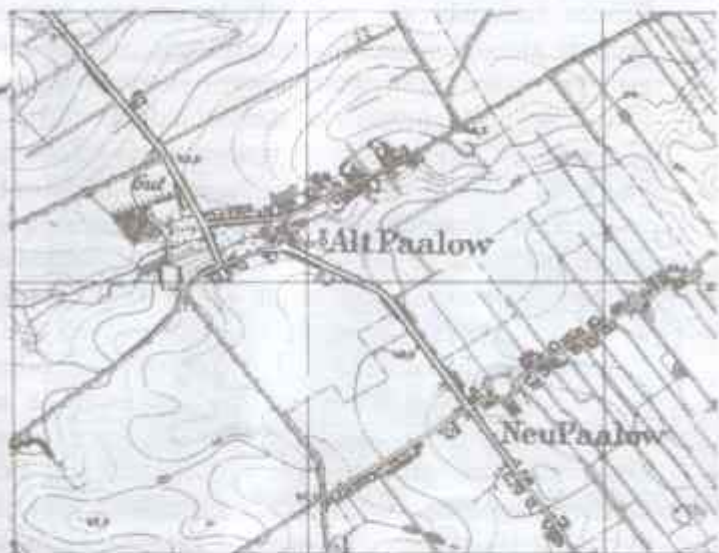
Mapa topograficzna z roku 1935 z Pałowem i Pałówkiem