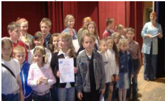
Na zdjęciu: w tym celu zdobycie I miejsca grupa „Kabareton” z Korlina.

Z innych przedstawień wyróżnienie otrzymała prezentacja przygotowana przez zespół teatralny z Zespołu Szkół w Postominiu za sztukę pt: „Aniołek w klatce”.