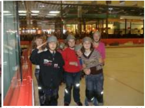
Centrum biznesowo-rozrywkowe Wilna * Ejszyszki - tu polsko ci siedlisko * Jak rozkaz to rozkaz- wyjazd na łód