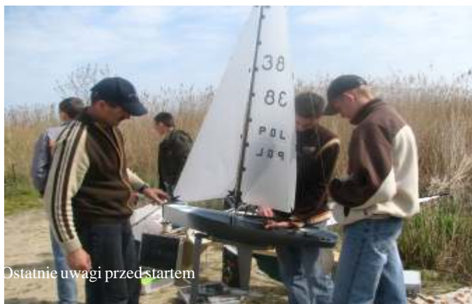
Ostatnie uwagi przed startem

Przez trzy dni ( 27-29.04 br.) nad jeziorem Wiczo w Łcku, dawnej zatoce morskiej oddzielonej od Bałtyku piaszczystymi mierzejami, rozegrano Ogólnopolskie Eliminacje Mistrzostw Polski Regat Jachtów Sterowanych Radiem w dwóch klasach F5-E i F5-10.