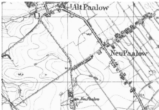
1. Mapa Pałówki z 1935 roku

Nazwa niemiecka: Neu Paalow, w latach 1945-1950 Pawłowice, później i obecnie Pałówko (utworzona od nazwy miejscowej Pałowo).