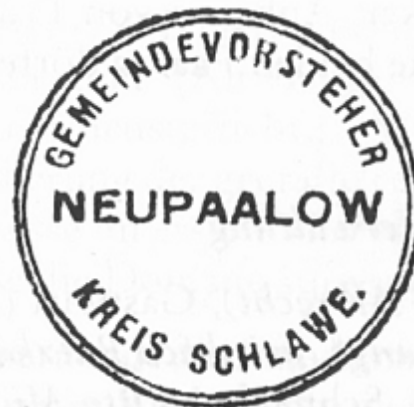
3. Pieczęć sołtyś Pałówki z lat 30-tych XX w.