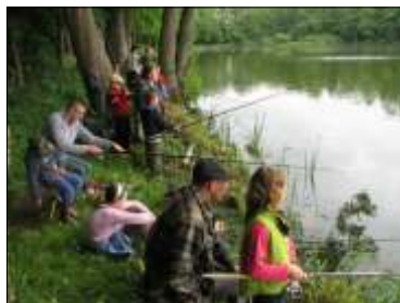
Najmłodsi w dkarzkie.

Zwycięzcy otrzymali do trzeciego miejsca w każdej grupie wiekowej puchary i dyplomy, oraz nagrody rzeczowe. Nagrody rzeczowe w postaci sprzętu w dkarzkiego i sportowego otrzymali również wszyscy startujący zawodnicy.