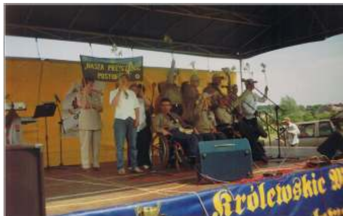
"Nasza Przyszłość" Postomino