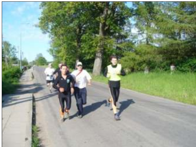
Kwietny Bieg 2007 - podczas biegu