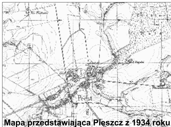
Mapa przedstawiająca Pieszcza z 1934 roku

Pieszcza wynosiła: w 1950 roku - 509, w 1960 - 526, w 1970 - 522, w 1980 - 531, w 1990 - 534, w 2006 - 516. Liczba gospodarstw domowych wynosi 126, a gospodarstw rolnych 24. We wsi działają Ochotnicza Straż Pożarna. Siedem sklepów, wietlica, działają szkoła podstawowa i gimnazjum, zbudowano nowy cmentarz i dom przedpogrzebowy. Wieś obecnie należy do parafii w Sławsku.