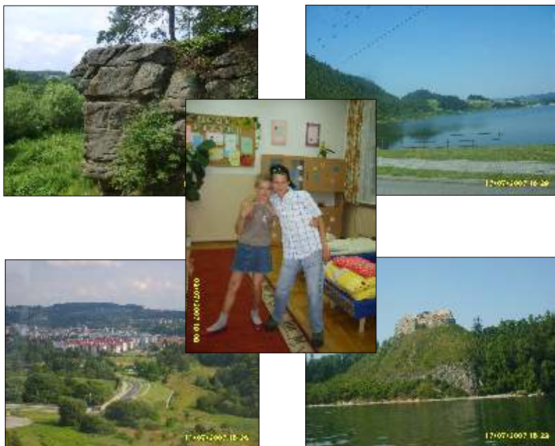
Powyżej zdjęcie naszych kolonistów i widoki, które podziwiali.

Projekt nie może rozpocząć się wcześniej niż 1 stycznia 2008 r. i trwać dłużej niż do 30 czerwca 2008 r.