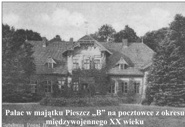
Pałac w majątku Pieszcza „B” na pocztowcu z okresu międzywojennego XX wieku

Wieś ma rodowód średniowieczny. Do 1945 roku nosiła nazwę Peest. Tu po wojnie przejeżdżają: Piastowice, Piastkowo.